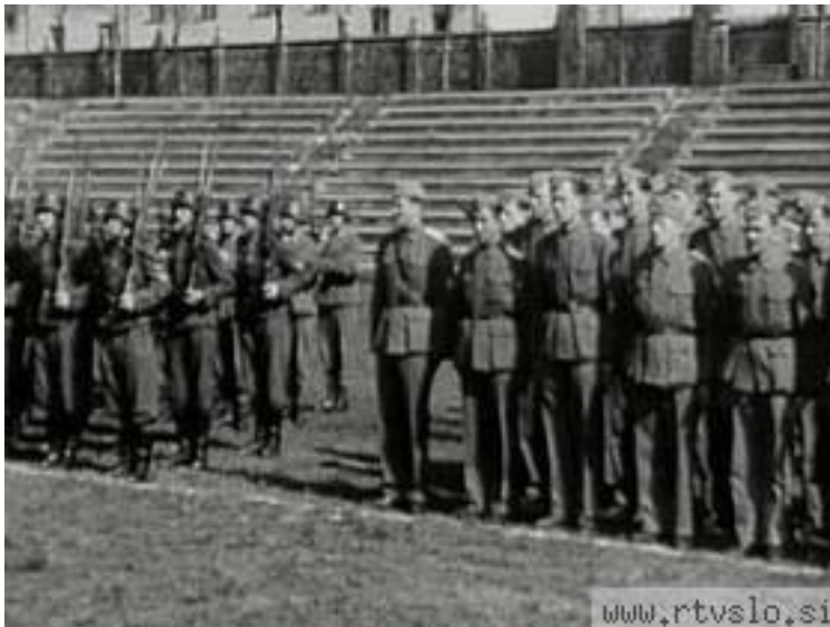
Domobranci na dan zaprisege

http://www.google.si/imgres?imgurl=http://img.rtv slo.si/upload/Slovenija/vojni_z_show.jpg&imgrefurl=http://www.rtv slo.si/slovenija/sodba-proti-rozmanu-razveljavljena/77653&usg=__7GrMYmXk_cDKizMokON5KR1wal=&h=210&w=280&sz=15&hl=sl&start=0&zoom=1&tbnid=g6s0m6nqpiC5-M:&tbnh=155&tbnw=207&ei=bGFITdigOdDu4gbc_9yqBQ&prev=/images%3Fq%3Dprisega%2Bdomobrancev%26um%3D1%26hl%3Dsl%26sa%3DG%26biw%3D1209%26bih%3D797%26tbs%3Disch:1&um=1&itbs=1&iact=hc&vpx=373&vpy=437&dur=4065&hovh=168&hovw=224&tx=129&ty=63&oei=bGFITdigOdDu4gbc_9yqBQ&esq=1&page=1&ndsp=20&ved=1t:429,r:11,s:0