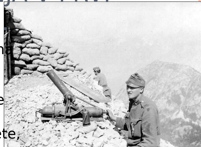
vojak z minometom

http://www.google.si/imgres?imgurl=http://www.drustvo-soskafronta.si/depo/kal_minomet1.jpg&imgrefurl=http://511517.yuku.com/topic/651/AO-poddesetnik-s-pnevmatnim-minometom-na-Kalu&usq=_JmH7NV0oXVdYejT6QIw-w9Pm5l=&h=431&w=590&sz=36&hl=sl&start=0&zoom=1&tbnid=b3lStB rk-p4cM:&tbnh=145&tbnw=198&ei=YL9JTaSticm14QaY6YTCw&prev=/images%3Fq%3Dminomet%26um%3D1%26h%3Ds%26gv%3D2%26biw%3D1209%26bih%3D797%26tbs%3Disch:1&um=1&tbs=1&iact=hc&vpx=330&vpy=88&dur=9&hovh=192&hovw=263&tx=152&ty=90&ei=YL9JTaSticm14QaY6YTCw&esq=1&page=1&ndsp=23&ved=1t:429,r:1,s:0