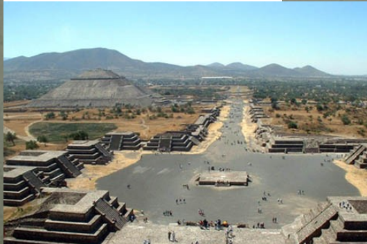
Teotihuacan - azteško svetišče