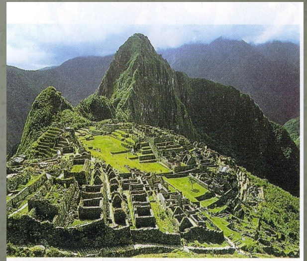
Machu Picchu - inkovsko svetišče