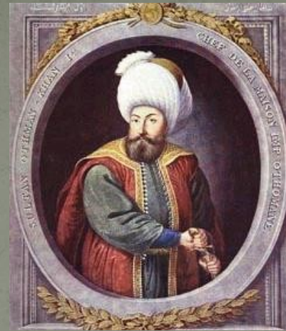
sultan Osman I.