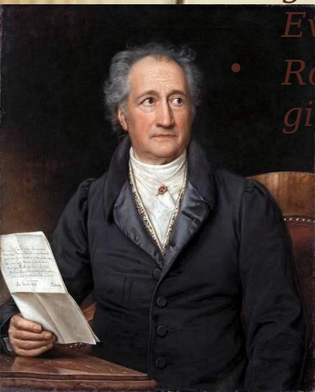
Johann Wolfgang Goethe (1749-1832)