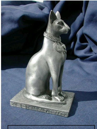
Slika 7 : Bastet