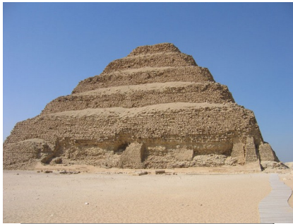
Slika 4 : Piramide

Gradbeništvo je zaznamovala predvsem gradnja piramid okoli 3000 pr.n.š.. Največja je Keopsova, poleg nje pa še Mikerinova in Icefrenova. Piramide so se razvile iz mastab. To so nižje prvotne grobnice stopničaste oblike. Če so hoteli postaviti piramido, so morali v bližini gradbišča s čolnom pripeljati velike kamnite bloke. Delavci so napravili ogromne klanče, po katerih so jih na valjih zvelikli navzgor. Graditi so jih začeli pred okoli 4500 leti. Sprva so bili čolni narejeni iz tamkajšnjega trstja, papirusa, pozneje pa že iz