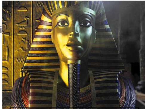
Slika 6 : Faraon

Faraoni so postali božanski kralji, ki so raznolika verovanja in božanstva uporabljali za utrjevanje svoje moči. Sončni bog Ra iz Heliopolisa je bil povezan s faraoni, ki so se imenovali 'Rajevi sinovi'. Ra vsako jutro odpotuje čez nebo in premaguje kaos in zlo. Še ponoči kroti zlo, dokler se zjutraj spet ne rodi. V čaščenju Reja so vladarji postali del njegovih zmag. Tokrat so bogovi iz drugih velikih središč, kot so Tebe in Memfis, postali njegovi zavezniki; ko pa je faraonski prestol zasedla dinastija iz Teb je svoje bogove prinesla s sabo in tako je nastal Amon-Ra. To se je dogajalo tudi z drugimi božanstvi: faraoni so si pridobili spoštovanje številnih različnih plemen tako, da so se sami povezali s krajevnimi bogovi. Nazadnje so svečeniki 12 poskušali vsa ta nakopičena božanstva spraviti v red in so ustvarili božanske družine, na primer Deveterico (Eneado), v devetih ravneh najvišjih božanstev. največ si je upal Amenofis IV. (1379 - 62 pr.n.š.), ko je razglasil, da je Aton, sonce, ki širi roke, da svetu daje življenje, edini Bog; drugi da so njegovi služabniki. Izbral si je novo ime, Ehnaton, " ta , ki služi Atonu ". Vendar se to ni obdržalo, Egipt se je vrnil na staro pot in še naprej prilagajal bogove, prevzemal kulte in verovanja, kakor so zahtevale potrebe časa.