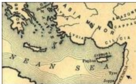
Slika 3 Istočna obala Mediterana domovina je ovoj čuvenog pomorskega naroda. http://upload.wikimedia.org/wikipedia/bs/thumb/f/f4/Phoenicia.jpg/180px-Phoenicia.jpg (11.4.2008)