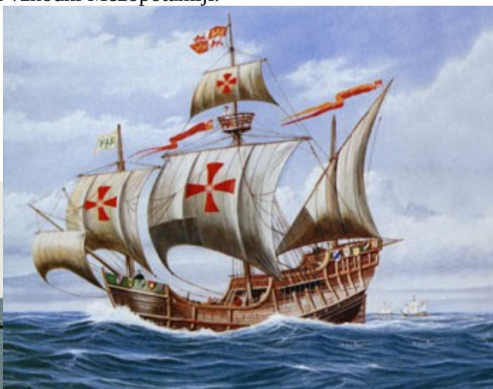
Slika 6 Takratne ladje.

http://img153.imageshack.us/img153/547/brod8oq0lr.jpg in