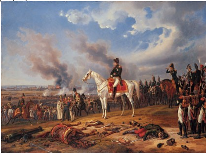
Slika 5 Slika s boja.

uporabili proti Grčiji. Aleksander Veliki je leta 332 pr. n .št. po zavzetju mesta Tir vključil Fenicijo v svoj imperij.