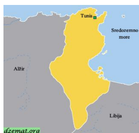
Slika 2 Feničani v Tuniziji http://fenicani.klin.org/tunis.jpg . (11.4.2008)