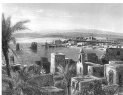
Slika 4 Takratno mesto.

Zgodovina Fenicije je zgodovina njenih velikih mest in kolonij, zlasti Biblosa, Tira, Sidona, Bejruta in Uparita. Mesta Fenicije so ohranile medsebojno neodvisnost.