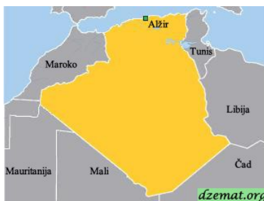
Slika 1Feničani v Alžiru.

Mesta so gradili na skalnatih rti ob morski obali ali pa na otokih v bližine obale. Eno najpomembnejših mest je bilo Biblos – v 3. tisočletju pr. Kr. so trgovali z Mezopotamijo, Egiptom, Mikenami in Kreto. V ½ 1. tisočletja sta vodilni mesti Sidon in Tir (vrh v času vladanja kralja Hirama I.) Vsaka mestna država je poleg mesta obsegala še okoliško podeželje. Vsakemu mestu je vladal kralj, ki se je pri vodenju posvetoval s svetom starešin (najpremožnejše trgovske družine) Zaradi majhnosti in lege so feničanska mesta mnogokrat priznavala nadoblast Egiptčanov, Hetitov, Asircev in Perzijcev.