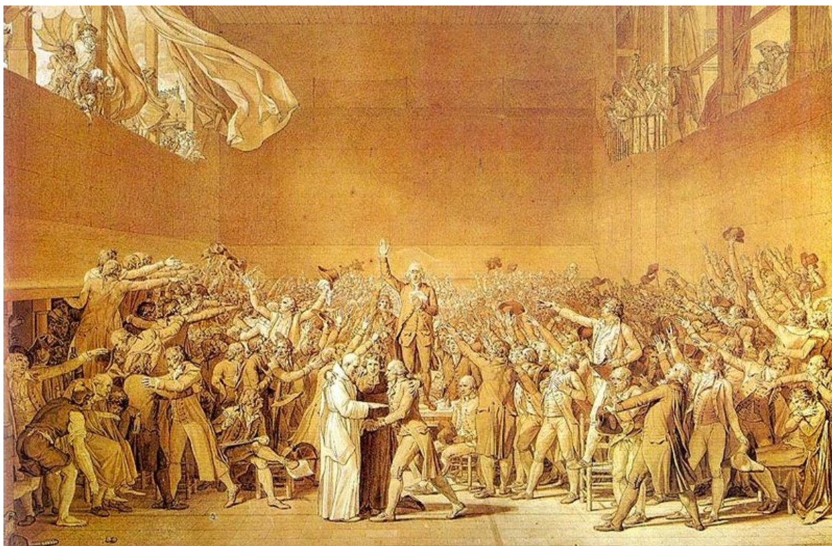
Prisega na igrišču za igre z žogo

~ parlament (narodna skupščina) je imela nalogo pripraviti ustavo