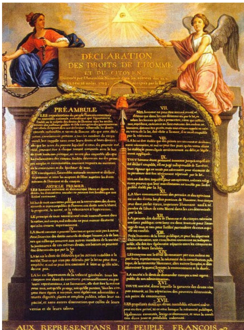
Deklaracija o pravicah človeka in državljana