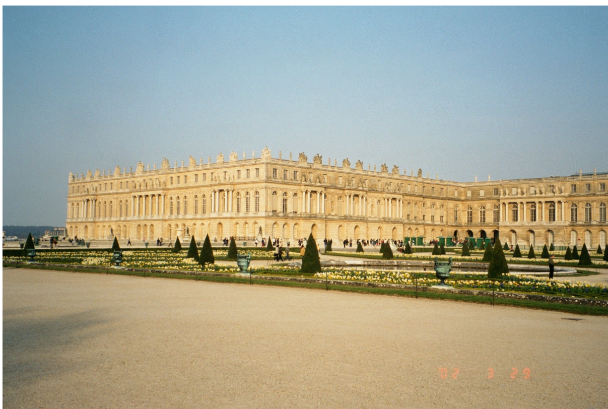
Versailles – »zibelka« francoske revolucije

Odločila sem se narediti seminarsko nalogo z naslovom Francoska revolucija. Že takoj na začetku me je pritegnil naslov. Vedno so me zanimala revolucije, predvsem pa vzroki za njih. Zanimivo je bilo opisovati zadnje trenutke absolutističnega vladanja v Franciji. Najbolj mi je bilo všeč opisovati jakobince. Ni bilo lahko najti ustrezne literature, saj so bile vse preveč strokovne. Največ je k tej nalogi pripomogel učbenik za 8r/9. S slikovnim gradivom ni bilo težav.