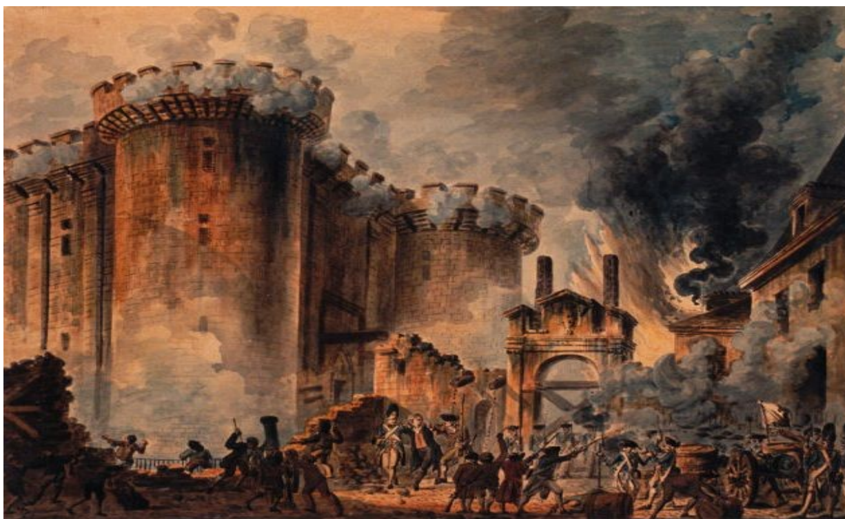
Napad na Bastiljo