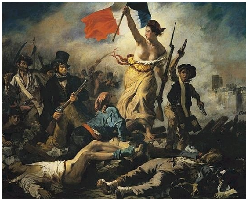
DELACROIX: LA LIBERTÉ GUIDANT LE PEUPLE

Leta 1795 je na čelo države postopoma prišel stopati Napoleon Bonaparte.