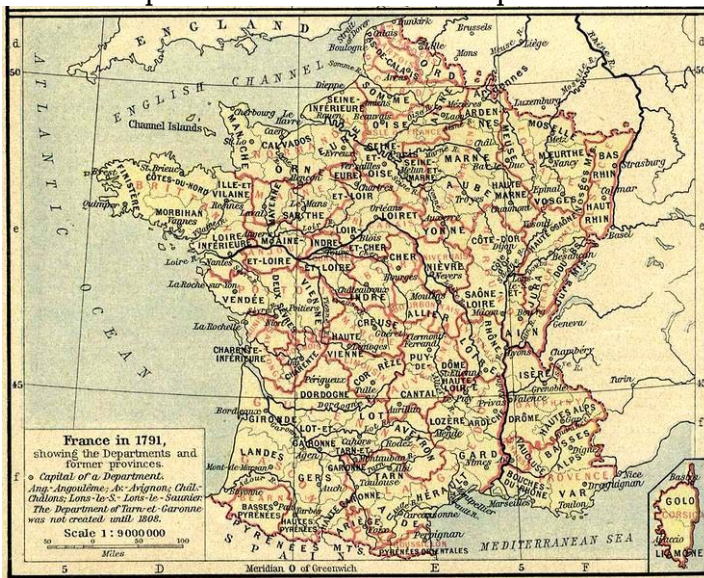
RAZDELITEV NA DEPARTMAJE 1791

Državo so po ustavi razdelili na 83 upravnih enot – departmajev.