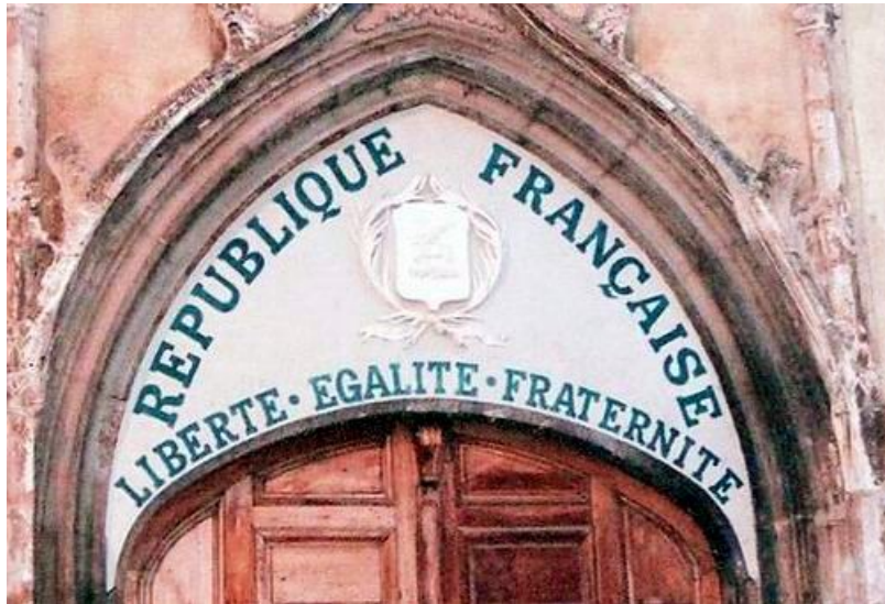
SVOBODA, ENAKOST, BRATSTVO