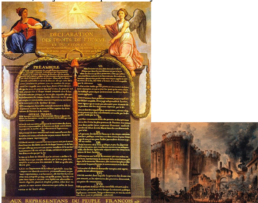
DEKLARACIJA ČLOVEKOVIH PRAVIC

26. avgusta je bila sprejeta Deklaracija o pravicah človeka in državljana , v kateri je zapisano, da se človek in državljan nikdar ne more odpovedati svojim naravnim pravicam, da so vsi ljudje svobodni in enakopravni, ter enako zavezani k plačevanju davkov, kraljeva oblast pa izvira iz ljudstva.