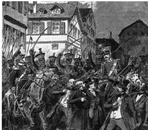
Slika 6: Pregon poslancev v Stuttgartu

Najprej so 5. aprila Frankfurt zapustili vsi avstrijski, kasneje še pruski in nato vsi konzervativni in buržuazijski poslanci. Ostala je samo liberalna skrajna levica, ki je vztrajala pri tem, da je 28 držav sprejelo njihovo ustavo in je organizirala proteste, ki pa so bili zatrti s strani pruske vojske. Pruska vlada pa je preostale poslance izgnala iz Frankfurta. Ti so se zatekli v Stuttgart in takrat so dobili žaljiv vzdevek Rumpfparlament («zadnjični parlament»), ki pa je bil kasneje zatrt z vojsko države Württemberg. Obstajala je še neuresničljiva ideja, da bi parlament preselili v Karlsruhe v Badnu.