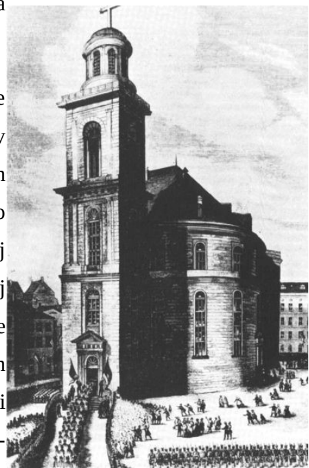
Slika 3: Prihod poslancev v Pavlovo cerkev

Že kmalu po prvem, sicer kaotičnem sestanku, se je vsa množica poslancev uredila. Sestajati so se začeli v klubih, ki so služili kot debatne skupine podobno mislečih in so se kasneje razvili v parlamentarne skupine. Te pa so se zaradi nestabilnosti povezale v tri večje "kampe". Kriterij za povezovanje je bil politična opredeljenost, še posebej opredeljenost do ustave. Prvi kamp je nosil ime Demokratična levica in je bil sestavljen iz zmernih in skrajnih levičarjev. Nadalje je bila tu Liberalna sredina, ki je združevala levo in desno-sredinske politike (klub Casino-desničarji in Württemberger Hof-levičarji). Tretji klub je nosil ime Konzervativna desnica in so ga sestavljali protestanti in konzervativci.