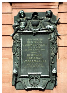
Slika 7: Spominska plošča na Pavlovi cerkvi

Delo frankfurtskega parlamenta in marčne revolucije je bilo ocenjeno zelo negativno v naslednjih letih. Buržoazijski liberalci so bili razočarani, mnogo jih je zapustilo politiko močno osovraženih od svojih someščanov v posameznih državah. Pozitiven odziv so zaključki frankfurtskega parlamenta dočakali šele v Weimarski republiki in še kasneje po drugi svetovni vojni, ko sta NDR in ZRN tekmovali v navajanju demokratične dediščine sklepov iz Pavlove cerkve kot specifično tradicijo ločenih držav.