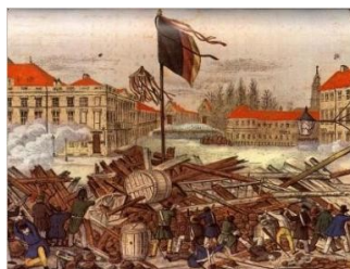
Slika 2: Revolucija leta 1848 v Nemčiji

Težav pri združevanju Nemčije očitno ni manjkalo, zato so tekom procesa mnogi nad tem projektom obupali, vendar želja ni izginila iz ljudskih src. Kljub mnogim vladarskim spletkam in polenom, katere je pod noge metala tujina, je nemški narod dosegel dogovor o organizaciji skupnega zborovanja, kjer bodo soočili poglede in argumente ter napravili korak naprej pri združevanju. Ta zbor je potekal v Frankfurtu na Majni, zato ga imenujemo frankfurtski parlament.