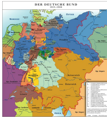
Slika 1: Nemška zveza ustanovljena po Dunajskem kongresu