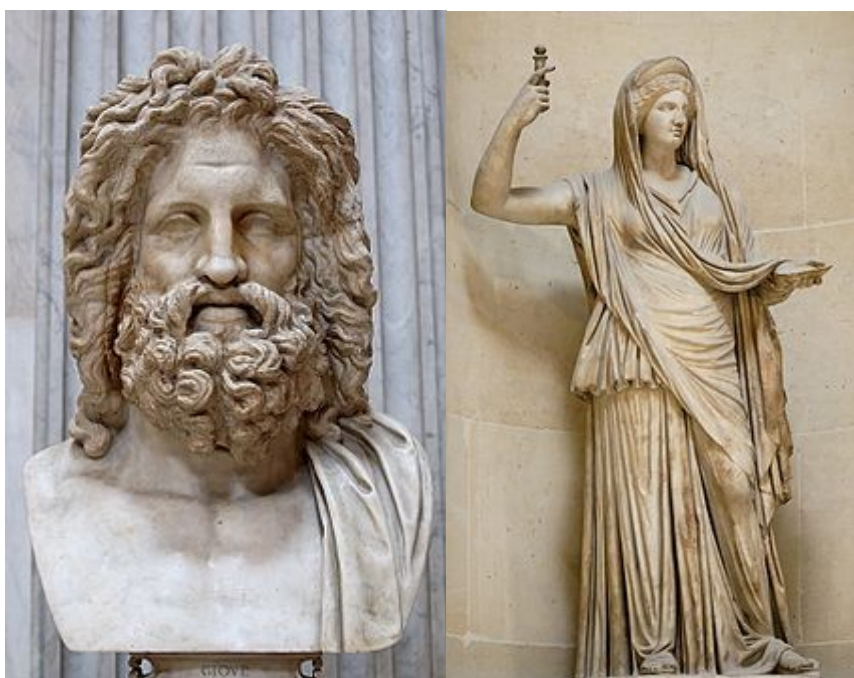
Doprski Zevsov kip

Zevs je poglavar vseh bogov, bog neba in nevihte. Predstavlja tudi čuvaja državne ureditve, zaščitnika pravice in boga svetlobe. Njegov simbol je hrast, v roki drži žezlo in strelo, ob njem pa je njemu posvečeni orel.