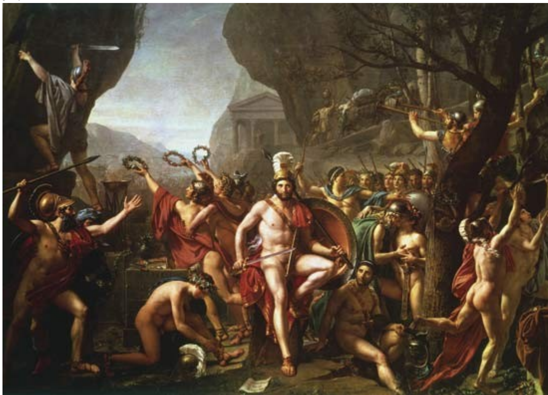
Slika št. 2, grško-perzijske vojne.