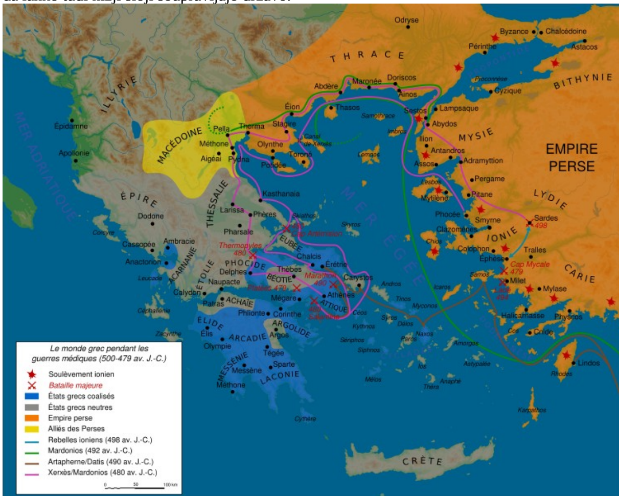
Slika št. 5, Zemljevid grško-perzijskih vojn.

Najbrž se sprašuješ, kako je tako maloštevilnim Grkom uspelo premagati velike in neustrašne Perzijce. Čeprav se morda ne zdi tako, so imeli Grki kar nekaj prednosti. Spomnimo se kako je Kserkses združil vse podjarmljene narode v eno vojsko, ki pa ni bila enotna. Grki so imeli enotno, homogeno vojsko, ki se je borila za svojo domovino, osebno svobodo, za politični red. Imeli so tudi boljše oboroženo vojsko, saj se Perzijci z loki in kratkimi sulicami niso mogli primerjati s grškimi vojaki, ki so imeli ščite, meče in dolge sulice. S tem pa prednosti na strani Grkov še ni konec. Imeli so boljše poveljnike in s tem poveljevanje, boljše tehnično podkovanost (še posebej v mornarici) in imeli so še eno prednost in sicer to, da so se borili na domačih tleh, tako da so boljše poznali prostor in okolico. Vendar so poleg vsega tega potrebovali še obilo sreče. Zmaga je v Atenah okrepila zavest o svobodi in tako so pokazali, da lahko tudi nižji sloji soupravljajo državo.