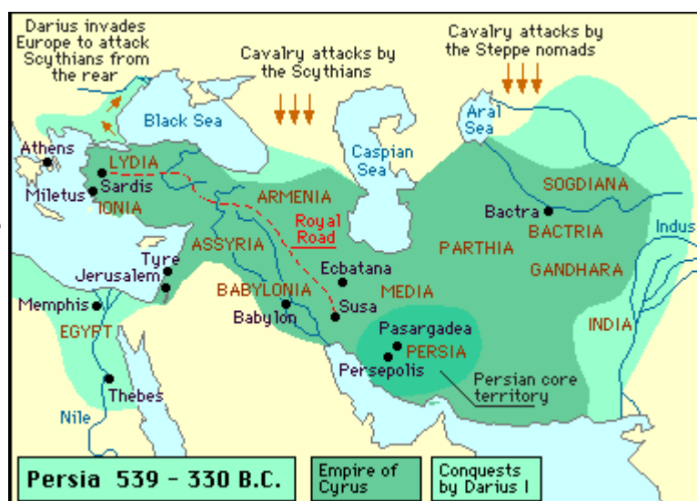
Slika št. 1, Ozemlje Perzije med leti 539 in 330 pr. Kr.