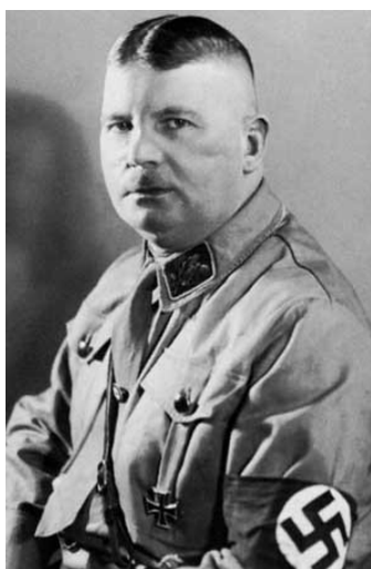
Slika 7: Ernst Röhm

Marka je padla na 18 tisoč za dolar, v juliju na 160 tisoč, avgusta 1 milijon in v novembru 1923 na 4 milijone mark za dolar. Nemci so zgubljali svoje prihranke, začeli so se 'štrajki' lačnih, saj so plače bile izplačane v brez vrednem denarju. Dokler je vlada nasprotovala plačilu odškodnine, so jo ljudje podpirali, ko pa se je vlada septembra 1923 odločila za plačilo odškodnine, se je med ljudi naselil nemir, kar so ekstremisti izkoristili in po Nemčiji povzročali kaos. Prišel je čas, da nacisti udarijo.