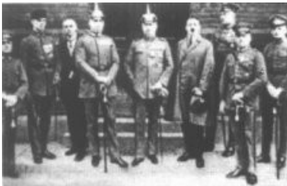
Slika 3: V vojski ( http://vsebine.svarog.org/index.php?page_id=124 )

spodkopavajo nemški vojni trud. Da bi pobegnil iz apatije, je zaprosil za vrnitev na fronto, kamor je odšel marca 1917. Bil je celo odlikovan z železnim križcem, kar je v njegovi klasi med pehoto bila redkost in poročnik, ki ga je priporočal, je bil Jud. Za Nemčijo izrazito poniževalno premirje je Hitler pričakal v bolnišnici, ker se je zastrupil z iperitom, in ta akt ter "izdaja civilne politike" sta nanj izredno vplivala. Postal je razočaran, zagrenjen in tako kot vsi vojaki se je spraševal o smislu dolge vojne. Žrtve, ki so padle za Nemčijo so bile zaman in Nemci so se počutili izdane, kar so pozneje pokazale novembrske demonstracije.