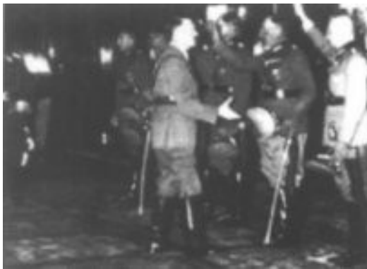
Slika 15: Hitler se je dobro razumel z generali

vrhovni poveljnik oboroženih sil. Prva zadeva, ki jo je hotel uresničiti, je bilo zavzetje Avstrije. Načrtoval je umor avstrijskega kanclerja Dollfusa na Dunaju, kar mu je 25. julija 1934 tudi uspelo. Še pred tem so nacisti zavzeli radijsko postajo, na kateri so objavili, da je kancler odstopil. Toda nacistični puč ni uspel, ker so vladne sile, ki jih je vodil Schuschnigg obvladale položaj, zarotnike polovile in jih 13 pozneje tudi obesili. Nato se je Hitler lotil obnovne zasedbe demilitariziranega Porenja in v teku zime 1935/36 je dočkal svoj trenutek. Francija in Velika Britanija sta bili prezaposleni z italijanskimi napadi na Etiopijo in 1. marca se je Hitler odločil. Njegovi generali so sicer bili prepričani, da jih bodo francoske sile zmlele. Vendar so kljub temu uspešno tvegali in dosegli ponovno osvojitve Porenja. Francija ni storila nič.