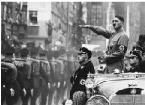
Slika 12: Hitler imenovan za nemškega kanclerja

Konservativni člani nekdanje aristokracije so republiki želeli konec in pričakovali so vrnitev avtoritativne vlade, ki bo Nemčiji povrnila sijaj in stare privilegije. Hoteli so se vrniti v cesarske čase in Hitler naj bi jim omogočil prvi korak, saj so vedeli, da si ne želi republike. Veliki bankirji in kapitalisti, skupaj s Kruppom in I. G. Farbenom, so lobirali za Hindenburga in mislili, da bo Hitler dober za njihove kariere. Obljubil jim je svobodno podjetništvo in omejevanje komunizma in delavskih gibanj (trade unions). Tudi vojska je stavila na Hitlerja, ker je obljubljal konec versajske pogodbe in razširitev vojske na nekdanjo slavo. Vsi pa so imeli nekaj skupnega - podcenjevali so Hitlerja. Čez nekaj tednov je Hitler postal absolutni vladar Nemčije in je sprožil verigo dogodkov, ki so rezultirali II. svetovno vojno in smrt skoraj 50 milijonov ljudi. Za začetek je Hitler videl nemško republiko, kako pada v plamenih in v februarju, 1933 so nacisti naredili načrt požiga Reichstaga, s čemer so hoteli popolnoma zaključiti z demokracijo.