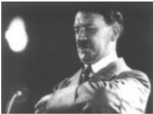
Slika 14: Hitlerjev govor

( http://vsebine.svarog.org/index.php?page_id=135 )