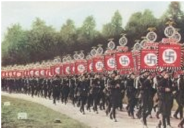
Slika 11: Proslavljanje zmage

detajlom. Uporabljal je preproste fraze, ki jih je vseskozi ponavljal. Nezaposlenim je ponujal delo, propadlim poslovnežem prosperiteto, industrialcem profit, povečano vojsko, socialno harmonijo, konec klasnega razlikovanja za mlade idealistične študente in za obupance - novo vzpostavitev nemške slave. Obljubil je red, enotnost, konec vojaških reparacij, konec versajske pogodbe, kontroliranje marksistov in ostro ravnanje z Judi. Ker se je obračal na vse nemške razrede je tudi ime stranke - nacionalna socialistična nemška delavska stranka - bilo namerno izbrano. Dan volitev, 14. septembra, je nacistom prinesel 6 milijonov 371 tisoč oziroma čez 18 odstotkov glasov. Dobili so 107 sedežev v Reichstagu in postali druga največja stranka v Nemčiji. Ko so 13. oktobra oblečeni v rjave srajce zavzeli svoje sedeže v parlamentu, niso imeli niti najmanjšega namena delati v imenu demokracije. Vedeli so, da bo v njihovo korist, če se bodo razmere v Nemčiji poslabšale. Nacistični civilisti so zmago praznovali tako, da so razbijali okna judovskih trgovin. Znamenje stvari, ki so šele imele priti.