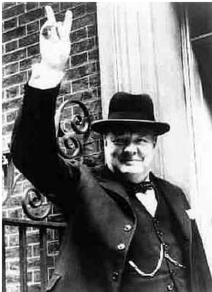
Slika 4: Winston Churchill ( http://www.solarnavigator.net/history/winston_churchill.htm )

A ker si je stranka želela pridobiti glasove srednjega sloja, se je temu programu odkrito odpovedala in edini, ki naj bi bili razlaščeni, bi bili Judje.