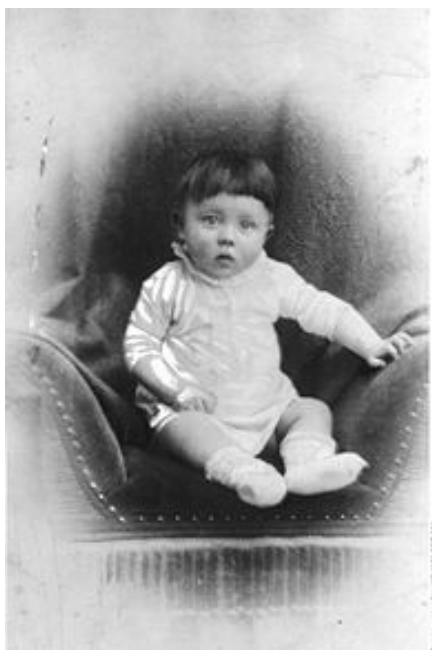
Slika 2: Hitler kot otrok