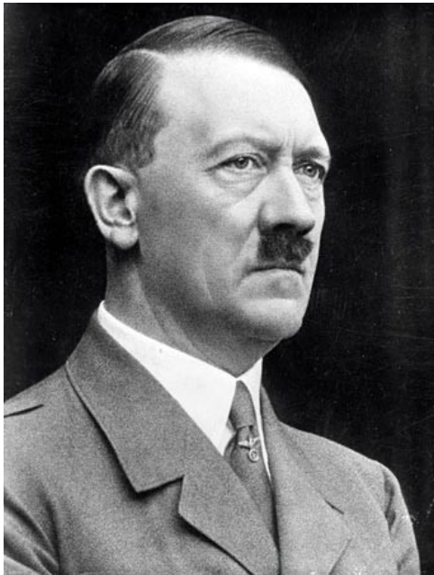
Slika 1: Adolf Hitler

Alois Hitler je imel skupno šest otrok, od katerih sta odrasla le Adolf in najmlajša sestra Paula. Očeta je Adolf Hitler v življenjepisu Mein Kampf sam opisal kot »vzkipljivega tirana«, vendar ni navedel ravnanja, ki bi bilo do otrok bolj trdo, kot je bilo takrat v navadi. Po pričevanjih znancev je bil oče Alois do žene in otrok hladen in grob. Že možnost, da bi bil Adolf Hitler delno judovskega rodu, mu je v kasnejšem bolestnem protijudovstvu morala biti v breme.