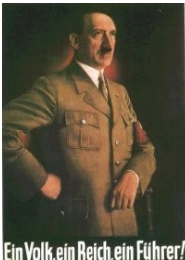
Slika 6: Oglas v časopisu ( http://vsebine.svarog.org/index.php?page_id=126 )

Marka je padla na 18 tisoč za dolar, v juliju na 160 tisoč, avgusta 1 milijon in v novembru 1923 na 4 milijone mark za dolar. Nemci so zgubljali svoje prihranke, začeli so se 'štrajki' lačnih, saj so plače bile izplačane v brez vrednem denarju. Dokler je vlada nasprotovala plačilu odškodnine, so jo ljudje podpirali, ko pa se je vlada septembra 1923 odločila za plačilo odškodnine, se je med ljudi naselil nemir, kar so ekstremisti izkoristili in po Nemčiji povzročali kaos. Prišel je čas, da nacisti udarijo.