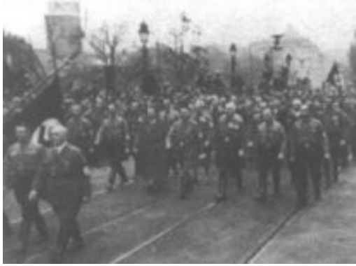
Slika 13: Vsakdanji nacistični marš

( http://vsebine.svarog.org/index.php?page_id=135 )