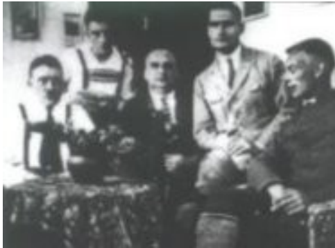
Slika 8: Adolf v zaporu

Hitler je imel občutek, da dobri časi ne bodo trajali dolgo. Republika je živila na sposojenem denarju in sposojenem času in enkrat ga bodo že poiskali, ko bo država v krizi. V letu 1926 je partija štela le 17 tisoč ljudi in prav nihče si takrat ne bi mislil, da bo Adolf Hitler nekega dne postal vsenemški voditelj.