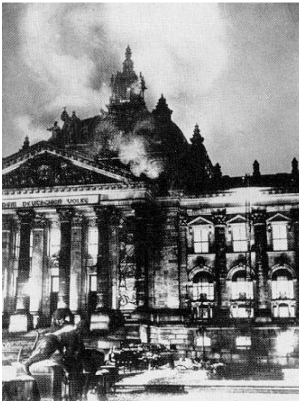
Slika 10: Reichstag v ognju ( http://www.911review.com/precedent/century/reichstag.html )

Čeprav so Nemci nujno potrebovali finančni program, ki bi ga morala sprejeti vlada, je kancler pri sprejemanju tega naletel na nasprotovanje opozicije. Zato je od predsednika Hindenburga zahteval naj se sklicuje na člen 48., ki je predsedniku dajal moč, da vlada po dekretu. To je povzročilo nasprotovanje opozicije, ki je zahtevala umik dekreta. Kot zadnjo možnost je kancler prosil predsednika naj razpusti Reichstag in razpiše nove volitve. Datum volitev je bil 14 september in Hitler je s svojo stranko šel v akcijo. Nemško ljudstvo je bilo naveličano revščine in je bilo pripravljeno poslušati kogarkoli, tudi Hitlerja. In prav on je bil tisti, ki jim je ponujal tisto, kar so si želeli. Vsakdanji kruh in službo tako, da so namesto masla proizvajali tanke.