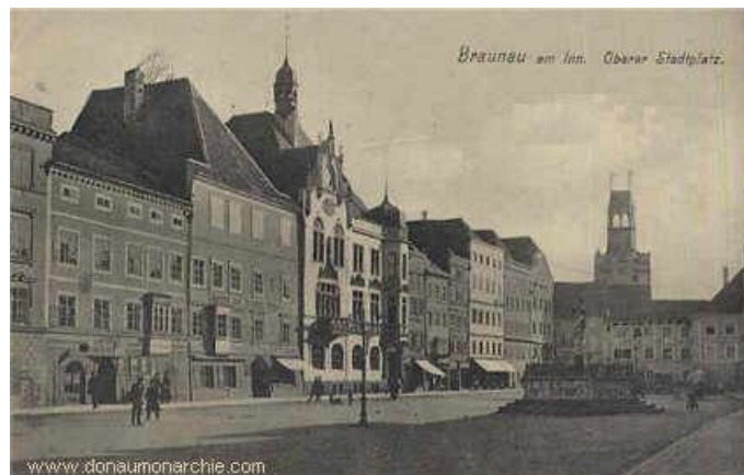
Rojstno mesto Adolfa Hitlerja

Adolf Hitler je v Linzu dokončal pet let osnovne šole. Že v tistem času ga je veselilo risanje. Leta 1907 se je preselil na Dunaj, da bi študiral slikarstvo, vendar so ga na akademiji dvakrat zavrnil. Preživljal se je s prodajanjem slik in izdelovanjem plakatov, saj ni želel študirati arhitekture, kot so mu priporočili na akademiji. Istega leta mu je umrla mati. Zdravnik, ki je ni mogel rešiti pred smrtjo, je bil po naključju Žid. Do svojega petindvajsetega leta je živel na Dunaju, potem pa se je preselil v München. Vsa ta leta je bil brez poklica. Njegov edini dohodek je bil prodaja lastnih slik.