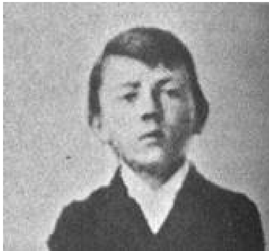
Adolf Hitler kot otrok

Rodil se je 20. aprila 1889 v mestecu Braunau am Inn, 90 km vzhodno od Linza, v deželi Zgornja Avstrija, takrat na meji avstro-ogrskega cesarstva. Oče Alois Hitler, rojen kot Alois Schicklgruber, je bil carinski uradnik, mati Klara Pölzl pa očetova nečakinja in tretja soproga. Po eni, ki naj bi bila manj verjetna, je bil njegov ded, Aloisov oče, judovskega rodu. Alois Hitler je imel skupno šest otrok, od katerih sta odrasla le Adolf in najmlajša sestra Paula. Očeta je Adolf Hitler v življenjepisu Mein Kampf opisal kot »vzkipljivega tirana«.