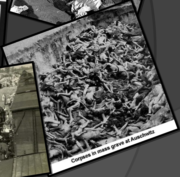
Corpses in mass grave at Auschwitz