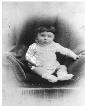
Adolf kot dojenček

Adolf Hitler se je rodil 20. aprila 1889 v mestu Braunau am Inn v deželi Zgornja Avstrija (tedanja Avstro- Ogrska). Oče Alois Hitler je bil carinski uradnik, mati je bila Klara Polzl. Oče je imel skupaj šest otrok od tega so le Adolf in najmlajša sestra Paula odrasli.