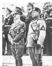
Hitler in Mussolini

22. maja 1939 je Hitler z Mussolinijem podpisal »jekleni pakt« vojaško zavezništvo, kateremu se pridružila še Japonska. Z Rusijo pa je sklenil pakt o nenapadanju.