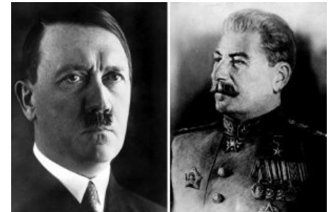
Hitler in Stalin