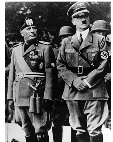
Mussolini in Hitler