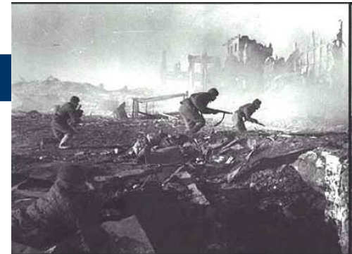
Bitka pri Stalingradu