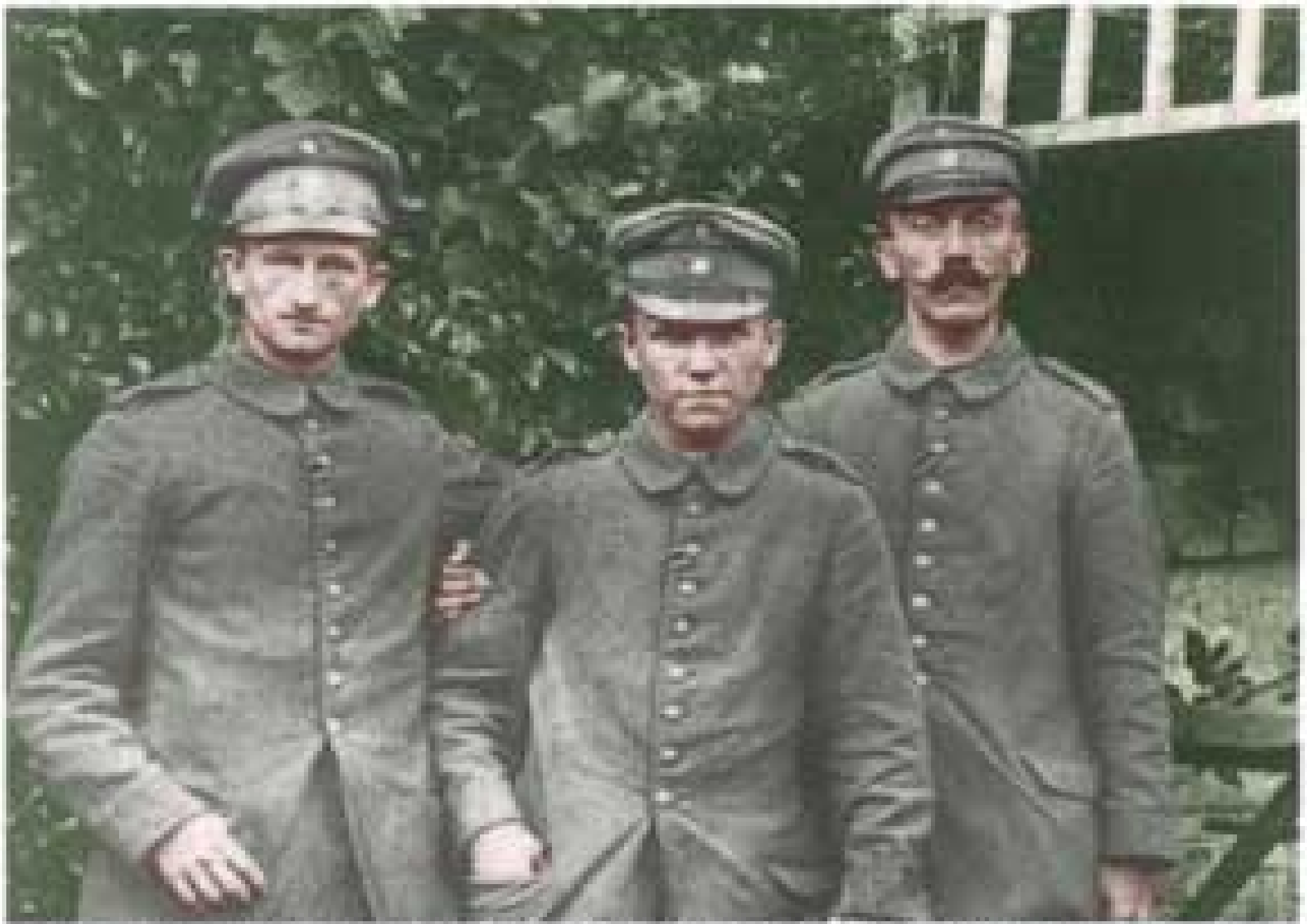
Hitler (right) and colleagues during the First World War