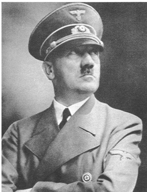
HITLER IN POLITIKA

Zaradi nezadovoljstva nad razmajano ureditvijo Habsburškega cesarstva se je leta 1913 izognil vpoklicu v vojsko in pobegnil v München. Tam se je ob izbruhu prve svetovne vojne pridružil bavarski vojski. Hitlerju je vstop v vojno prinesel nekaj čisto novega. Tu se je končno lahko enačil z drugimi in imel enake možnosti kot ostali.