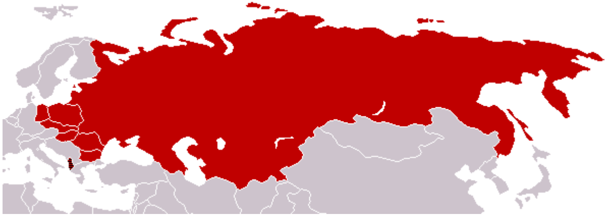
Slika 1 - Slika prikazuje obsežnost Varšavskega pakta