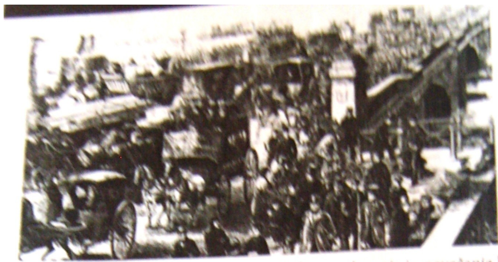
Na glavnem mostu v Londonu, leta 1872 (promet je bil takrat zelo živahen)

Industrijska revolucija je spremenila videz pokrajine. Vse do začetka 19. stoletja so Evropejci živeli predvsem od kmetovanja in na podeželju. Ljudje so izgubili službe zaradi ogrevanja in položaj kmetov se je poslabšal. Predvsem zaradi tega, ker kmetje na trgu niso bili konkurenčni proizvajalci, ki so živila proizvajali s pomočjo mehanizacije. Slednja so namreč bila cenejša, pa še pridelali so več. Za nameček pa so v delo vložili še manj truda in časa. Zaradi slednjega je bilo najprej v Veliki Britaniji veliko brezposelnih, dela željnih ljudi. Predvsem kmetje so zapustili podeželje in se preselili v nova industrijska mesta, v katerih so se širile tovarne. Moški so se zaposlovali predvsem v rudnikih in železarnah.