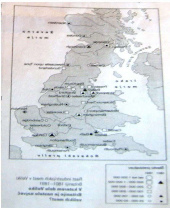
Rast industrijskih mest v Veliki Britaniji (1801-1891)

Industrijska revolucija je mnogim spremenila življenje. Zaradi boljših življenjskih razmer je namreč število ljudi naraščalo . Na začetku leta 1800 je imela Velika Britanija okoli deset milijonov prebivalcev, čez petdeset let pa še enkrat toliko, 21 milijonov. Tolikšen prirastek pa je bil mogoč zaradi boljše zdravstvene oskrbe (iznajdba novih pripomočkov), intenzivnega obdelovanja in povečanja kmetijskih površin. Osnovna živila so bila v primerjavi z Evropo poceni, predvsem zaradi dejstva, ker je bilo v Veliki Britaniji proizvedena večja količina živil v krajšem času (seveda zaradi mehanizacije).