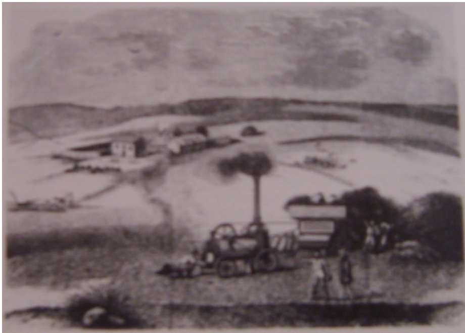
Parna mlatilnica, 1872. (Mehaniziranost kmetijstva se je uvedbi parnega pogona še hitreje razvijala, zato pa je bilo potrebnih vedno manj poljedeljskih delavcev).

bombažne. Na tem področju so bili iznajdeni vedno novi predilni pripomočki, kot npr. predilni stroj na vodni pogon. Uvedba Cartwrightovih mehaničnih statev pa je celo pomenila konec tkanja z ročnimi statvami. Mehanizacija v tekstilni industriji pa je tako spodbudila nastanek tovarniške mreže. Tako ženske in otroci (ki so si morali že v zgodnjem otroštvu z delom služiti denar), pozneje pa tudi moški, niso delali več doma v domači obrti, pač pa so hodili delat za mezde v tovarne, kjer so ritem določali parni stroji.