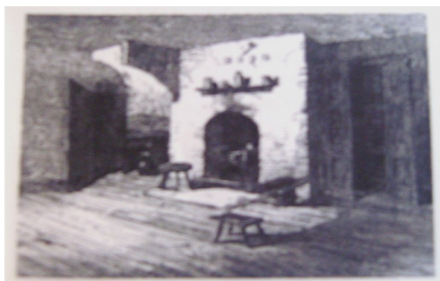
Dom predilca leta 1862 v Manchestru

V revnih delavskih družinah so delale tudi ženske . Največ jih je bilo zaposlenih v tekstilnih tovarnah. Čeprav je bil njihov delovnik enako dolg kakor pri moških, je bilo njihovo plačilo veliko manjše.