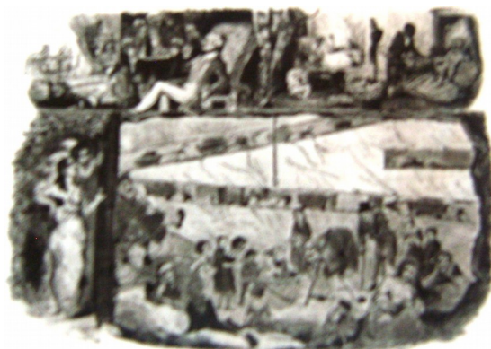
Karikatura na sliki z naslovom Kapital in delavci (leta 1843 je bila objavljena v britanskem časniku Punch).