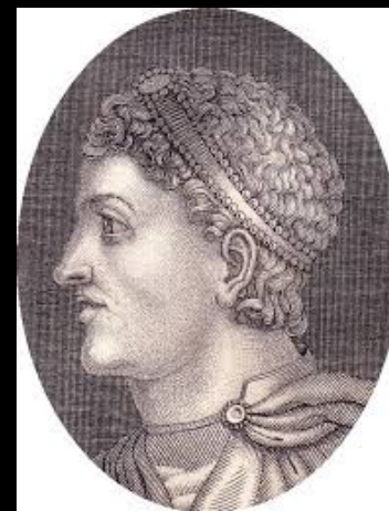
Teodozij I. Veliki