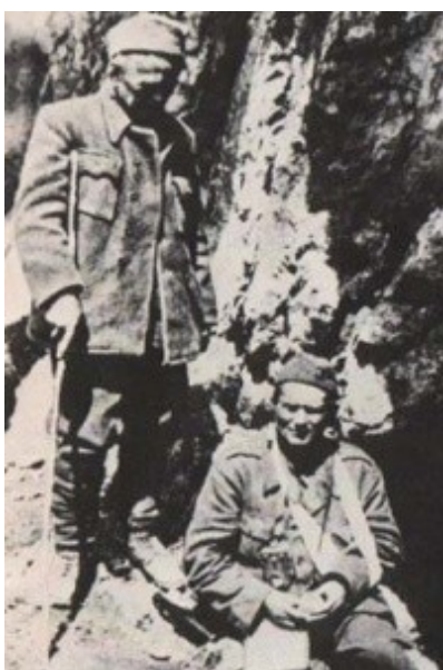
Tito in Ivan Ribar med ofenzivo na Sutjesko.