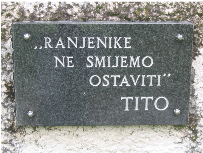
Besede Tita in vodilo NOV še posebej v Bitki na Neretvi (bitki za ranjence)