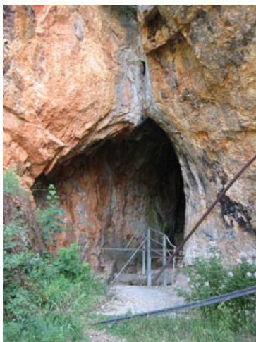
Jama, v kateri se je skrival Tito ob desantu na Drvar.