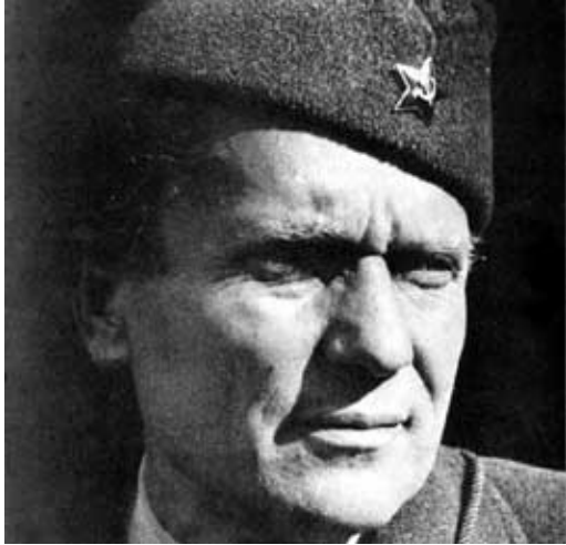
Josip Broz Tito