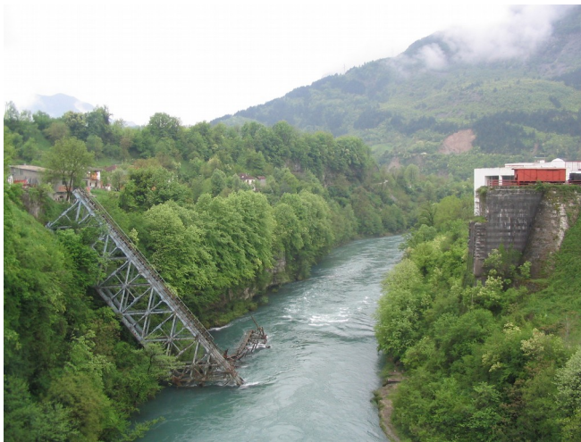
Ostanki mosta, porušenega v Bitki na Neretvi