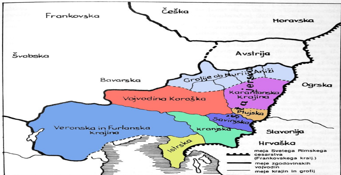
Karantanija po letu 976 — velika vojvodina Svetega Rimskega cesarstva, z osrednjo vojvodino Koroško ter krajinami: Karantansko, Ptujško in Savinjsko (iz njih je nastala Stajerska), Kranjsko, Istrsko, Furlansko in Veronsko (kasneje Benečija). Vzhodna krajina (Avstrija) je od 876 spadala k Bavarski.

izgubila svojo notranjo samostojnost. Postala je le ena od frankovskih grofij s frankovskim grofom in fevdalci na čelu. Zemlja je pripadla frankovskemu vladarju, ta pa jo je podeljeval plemstvu in duhovščini. Načelno plemstvo se je namemčilo. S temi spremembami se je prekinil