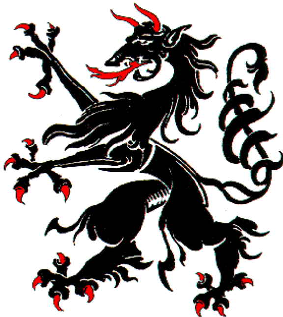
ČRNI PANTER GRB DRŽAVE KARANTANIJE 1160

Po navedbah kronista Fredegarja so se leta 623, v 40. letu vladanja frankovskega kralja Klotarja II., dvignila slovanska ljudstva v Srednji Evropi, ki so jih bili podjarmili Obri, in se uprla svojim zatiralcem.