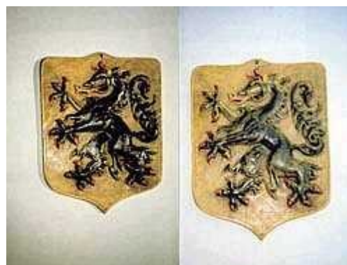
Karantanija s Kranjsko okoli leta 597

Karantanija (po staroslovensko Korotan) je bila slovanska plemenska kneževina v vzhodnih Alpah.