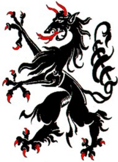
ČRNI PANTER GRB DRŽAVE KARANTANIJE 1160

Karantanija je nastala v boju proti Avarom na vzhodu in Germanom na zahodu. Bila je fevdalno urejena kneževina.