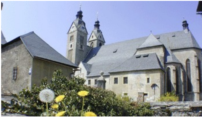
slika 5 Gospa sveta

Razvejeno pastoralno dejavnost salzburških misijonarjev dokazuje vrsta cerkev, ki jih med svojim delovanju v Karantaniji posvetil škof Modest.