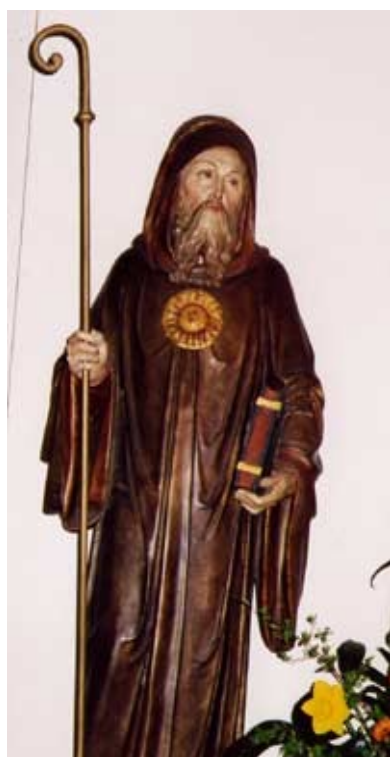
slika 3 Kolumban