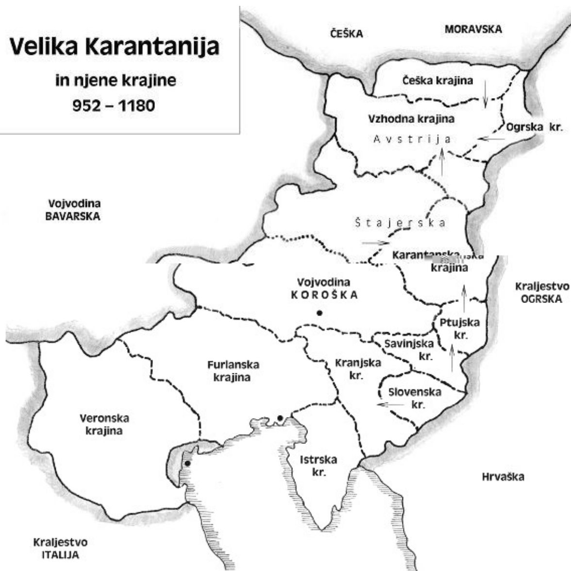
slika 2 Velika Karantanija