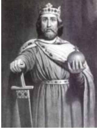
slika 7 Karel Veliki

Za aktivnejšo vlogo pri postavitvi cerkvenoupravne ureditve na ozemlju oglejskega patriarha je patriarha Pavlina skušal pridobiti opat Alkuin, vodja palatinske šole v Aachnu.V času t. i. karolinške renesanse je začel Karel Veliki na pobudo opata Alkuina sistematično urejati tudi zunanjo cerkvenoupravno zgradbo v državi.