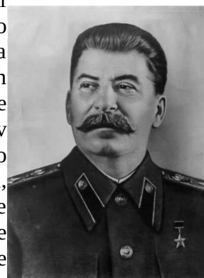
V. Slika 5 : Josip Visarijonovič Stalin