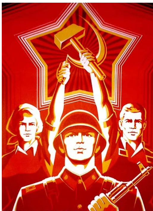
VIII. Slika 8: Ljudje in vojska so eno!

Ta primer propagande spodbuja razvoj aviacije, ki je prikazan kot obletavanje Ruske letalske flote nad Rdečim trgom polnim državljanov Sovjetske zveze.