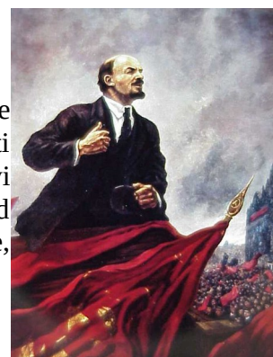
I. Slika 1: Vladimir Iljič Ulanov - Lenin

Zaradi tega se je njegova podpora iz strani delavstva še bolj povečala. Tako se je jasno postavil po robu začasni vladi, ki je želela nadaljevati vojno proti centralnim silam. Vse več ljudi je v naslednjih tednih podprlo zlasti njegovi zahtevi, da je treba končati vojno in izpeljati celovito zemljiško reformo v prid kmetom. Toda vodilni boljševiki spomladi 1917 še niso sprejeli Leninove teze,