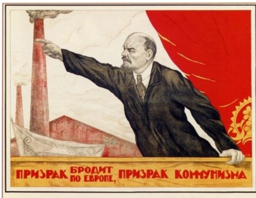
VI. Slika 6: Evropo preganja duh, duh komunizma!

V komunizmu je imela velik del obveščanja in prepričevanja ljudi v ta družbeni red propaganda. Za propagando so uporabljali letake, plakate medije in s tem krepili komunistično zavest prebivalcev Sovjetske zveze.