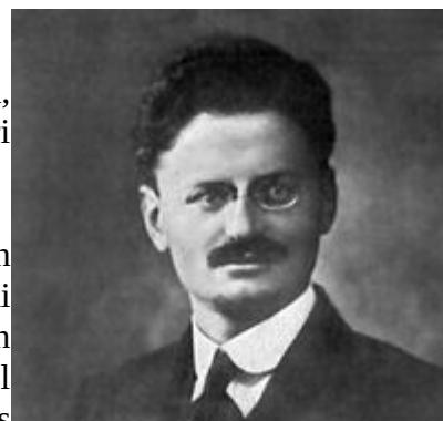
IV. Slika 4 : Lev Trocki

Trocki se je rodil kot Bronštejn (Бронштейн). Bil je vpliven politik v prvih dneh Sovjetske zveze, najprej kot ljudski komisar za zunanje zadeve in kasneje kot ustanovitelj in poveljnik Rdeče armade ter ljudski komisar za obrambo. Bil je tudi med ustanovnimi člani politbiroja. Zaradi spora s Stalinom v 20. letih 20. stoletja so ga izključili iz Komunistične partije in izgnali iz Sovjetske zveze. Kasneje ga je v Mehiki umoril sovjetski agent. Njegov nazor tvori temelj komunistične teorije trockizma.