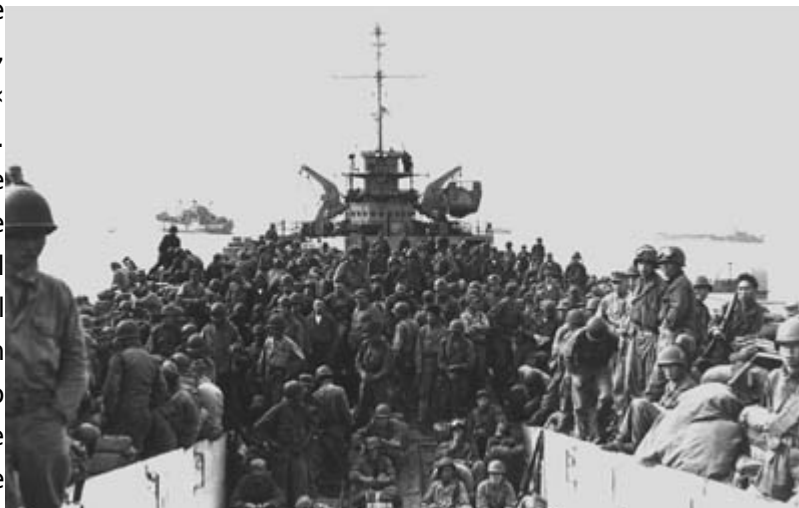
Slika 9: Operacija Chromite

Ko se je v avgustovsko-septembrskih bojih MacArthur prepričal, da bo pusansko mostišče zdržalo, se je odločil za tvegano, a po njegovem mnenju nujno akcijo. V zaledje severnokorejskih položajev je izkrcal močne vojaške sile, začela se je »četrti faza« korejske vojne. V poročilu 15. avgusta 1950, ko se je desantska operacija začela, je zapisal, da se je zanjo odločil zato, da bi presekala oskrbovalne poti Severnih Korejcev, ki po večini potekajo preko Inčona in Seula. V boj je poslal, operacija se je imenovala Chromite, 70.000 mož, 215 ladij in 350 letal. To pot so bile sile sestavljen iz več držav. Med ladjami je bilo 194 ameriških, 23 britanskih, 3 kanadska, 2 avstralski, 2 novozelandski, 1 francoska in 1 nizozemska. Po dvajseturnem topniškem obstreljevanju je ameriški pehoti uspelo v naskoku zavzeti utrjeni otok Volmi pred pristaniščem Inčon, pristanišče samo in letališče Kimpo, ki leži 10 km severno od Inčona.