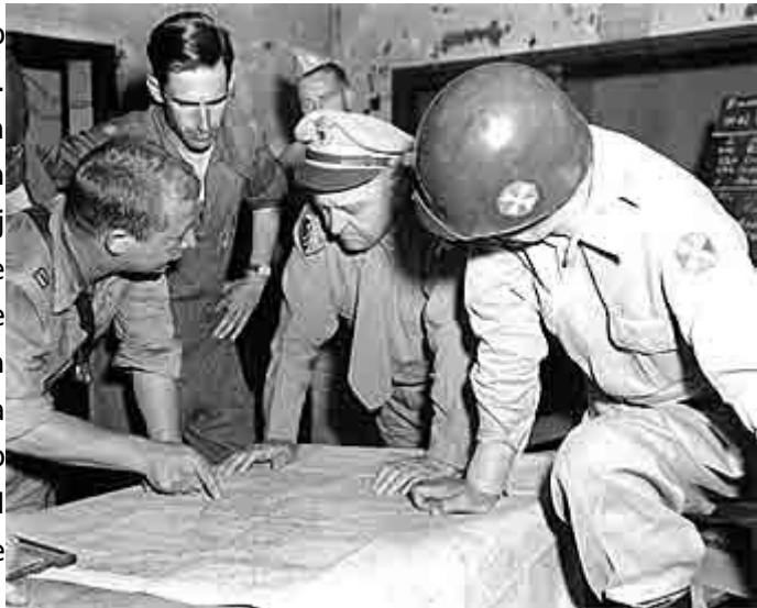
Slika 8: poveljnik 8. armade, general Walker

Na bojišču se je vse odvijalo drugače od ameriških pričakovanj. Obrambna črta na reki Han ni vzdržala in fronta se je predvsem na jugozahodnem delu Koreje vse bolj pomikala proti jugu. MacArthur se je odločil za načrtni umik in izmikanje bojem, da bi pridobil čas, obenem pa je vedno znova zahteval okrepitve, da bi lahko izenačil severnokorejsko premoč. Sredi julija so čete OZN postavile novo frontno črto, s katere ključna točka je bilo veliko južnokorejsko mesto Težon ob reki Kum. To mesto naj bi držalo frontno črto, od katere ni odstopanja. Mesto je branila 24. ameriška divizija, ki ji je poveljeval general William Dean. Že 18. julija se je začelo obkoljevanje Težona, naslednjega dne je »Ljudska armada« mesto že obkolila in zjutraj 20. julija se je začel napad. Čete, ki jih je poveljnik 8. armade Walker poslal na pomoč – 25. divizija, ki se je 10. julija izkrcala v Pusanu, in 1. konjeniška divizija, ki se je 18. julija izkrcala v Pohangu, obe sta prišli iz Japonske – so Severni Korejci zaustavili in do opoldneva 20. julija je bil Težon zavzet. General Dean je z ostankom svoje divizije panično zbežal, nekaj tednov blodil po hribih, dokler ga končno niso ujeli.