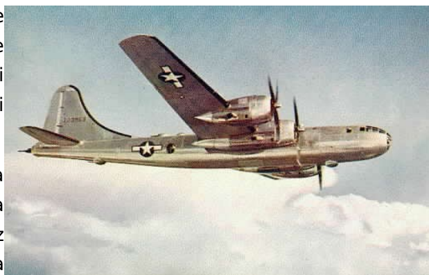
Slika 7: Bombnik B-29