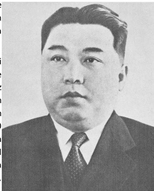
Slika 2: Kim Il Sung

V Južni Koreji je proces obnove državnosti potekal sicer nekoliko bolj demokratično, vendar se je tudi tu oblikovala diktatorska oblast, le da z drugačnim predznakom. Oblast je pod ameriškim patronatom prevzel Dr. Syngman Rhee, član korejske kraljevske dinastije Li, ki so jo leta 1910 odstavili Japonci, ter vodja nacionalističnega protijaponskega odpora. Za njegovim hrbtom je stal ameriški poveljujoči general Hodge. Rhee, ki so ga imenovali tudi »železni«, je bil njegov stari znanec, saj je velik del svojega življenja preživel v Ameriki.