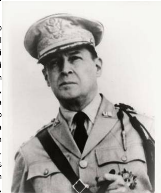
Slika 6: General MacArthur

ZDA so bile torej v vojni in njihova vlada je pozvala sovjetsko, naj vpliva na Severno Korejo, da umakne svoje sile iz Južne Koreje. Sovjeti pa so 30. junija odgovorili, da so vojno začeli z juga in naj odgovornost prevzamejo tisti, ki jo podpirajo. Kmalu je bil Truman napaden, da je OZN