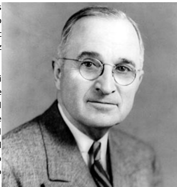
Slika 12: Takratni predsednik ZDA, Harry Truman

Na generalovo ponudbo sta se hkrati odzvala Peking in Washington. Peking je ponudbo odločno zavrnil, ker se ni nameraval podrediti ameriški agresiji in dokler OZN ne umakne resolucije, s katero je Kitajsko razglasil za napadalca. Washington se je sprva odzval strpno. Izrazil je le začudenje nad potezo generala in podčrtal, da bi bilo tako izjavo treba najprej predložiti Washingtonu. General pa je postajal vse bolj agresiven in kritičen do Trumanove politike. Predsednik Truman se je 8. aprila 1951 sestal z obrambnim ministrom generalom Georgom C. Marshallom in načelnikom generalštaba Omarjem Bradleyem. Na konferenci so ugotovili, da so najnovejše izjave v nasprotju z ameriško politiko, eden od demokratičnih senatorjev pa je celo opozoril, da bi utegnila izjava generala potisniti ZDA še globlje v vojno in postaviti na preizkušnjo potrpljenje drugih velesil v OZN. 11. aprila je 71-čletni general Douglas MacArthur dobil od predsednika ZDA Harryja Trumana ukaz, s katerim je bil razrešen vseh vojaških dolžnosti na Daljnem vzhodu. Namesto njega je imenoval dotedanjega poveljnika 8. ameriške armade generalporočnika Matthewa B.