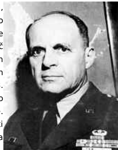
Slika 11: Matthew Ridgway, ki je nasledil generala Walkerja

Pobudo za miroljubno rešitev je podprl tudi Churchill, pa tudi SZ ni bila drugačnega mnenja. Toda Truman je po kitajskem vdoru vendarle zatrjeval, da se sile OZN ne nameravajo umakniti, saj potem noben narod ne bi bil več varen. Že 6. decembra je severna vojska osvojila Pjongjang in do 24. decembra so Severni Korejci in Kitajci na zahodnem in osrednjem delu fronte potisnili nasprotnika nazaj do 38. vzporednika. Do konca decembra so se sile OZN preko pristanišča Hungnam umaknile tudi z vzhodnega dela fronte. V teh bojih je bil ubit poveljnik 8. armade general Walker, ki ga je nasledil general Matthew Ridgway. Že 14. decembra pa je Generalna skupščina OZN s 52 proti 5 in ob vzdržanem glasu Čangkajškove Kitajske sprejela zahteva 13 držav po oblikovanju »komisije treh«, ki naj omogočijo ustavitev ognja na Koreji. Sestavljena je bila iz predstavnikov Irana, Indije in Kanade. Sovjetski delegat Malik pa je tako odločitev kritiziral, češ da morajo iz Koreje najprej oditi vse tuje sile, saj bo sicer delovanje komisije omogočilo le premor ameriškim silam na Koreji. Takega prepričanja so bili tudi Severni Korejci in so tudi po končani »deveti fazi« korejske vojno ter ko so dosegli 38. vzporednik, nadaljevali s preganjanjem nasprotnika. Januarja 1951 so ga porinili že na 37. vzporednik in ponovno je padel Seul. Tu, približno 150 kilometrov južno od reke Han, se je umik sil OZN končal.