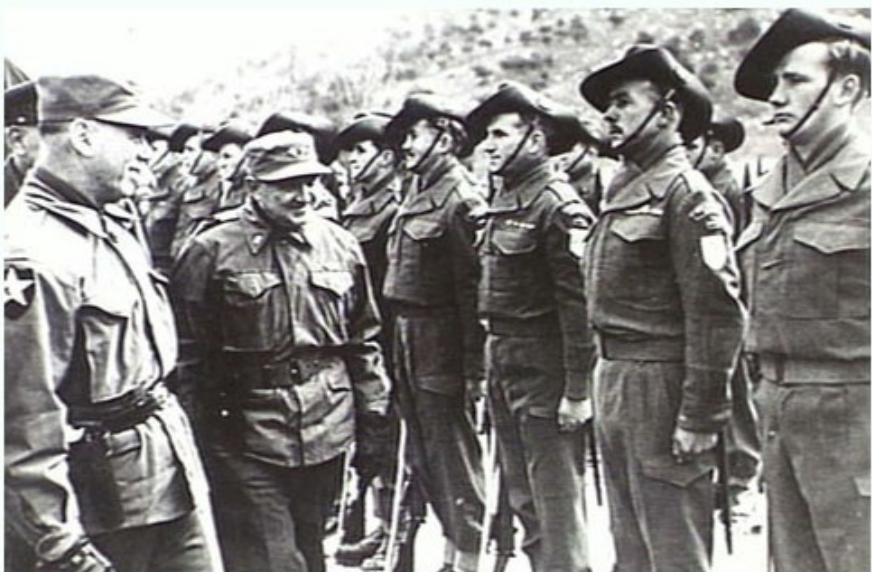
Slika 13: General James van Fleet

maja so Severnjaki začeli na vzhodnem delu fronte novo, zadnjo ofenzivo in vdrl globoko proti Seulu ter prišli do zunanjih obrambnih črt južnokorejskega delavnega mesta. Dan potem, ko so dosegli najjužnejšo točko, torej 21. maja, pa so se začeli na vsej fronti umikati. Morda je bil razlog za to, ker so imel v petdnevni ofenzivi po zadnjih virih skoraj