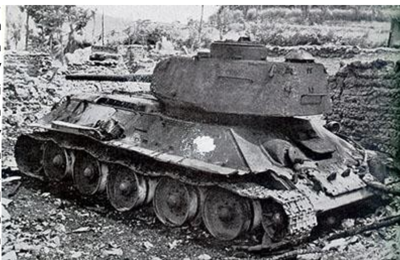
Slika 5: Tank T-34

Kot obseden je zgrabil hlače in srajco in stekel iz hiše... na Koreji se je delal dan. V Washingtonu pa je bila ura tri popoldne, sobota 24. junija 1950. predsednik Harry Truman je bil v podeželskem Independenceu v Missouriji, kamor je pogosto zahajal konec tedna. Okrog desetih zvečer je v leseni hiši na North Delaware Streetu zazvonil telefon. Državni sekretar Dean Acheson je klical iz