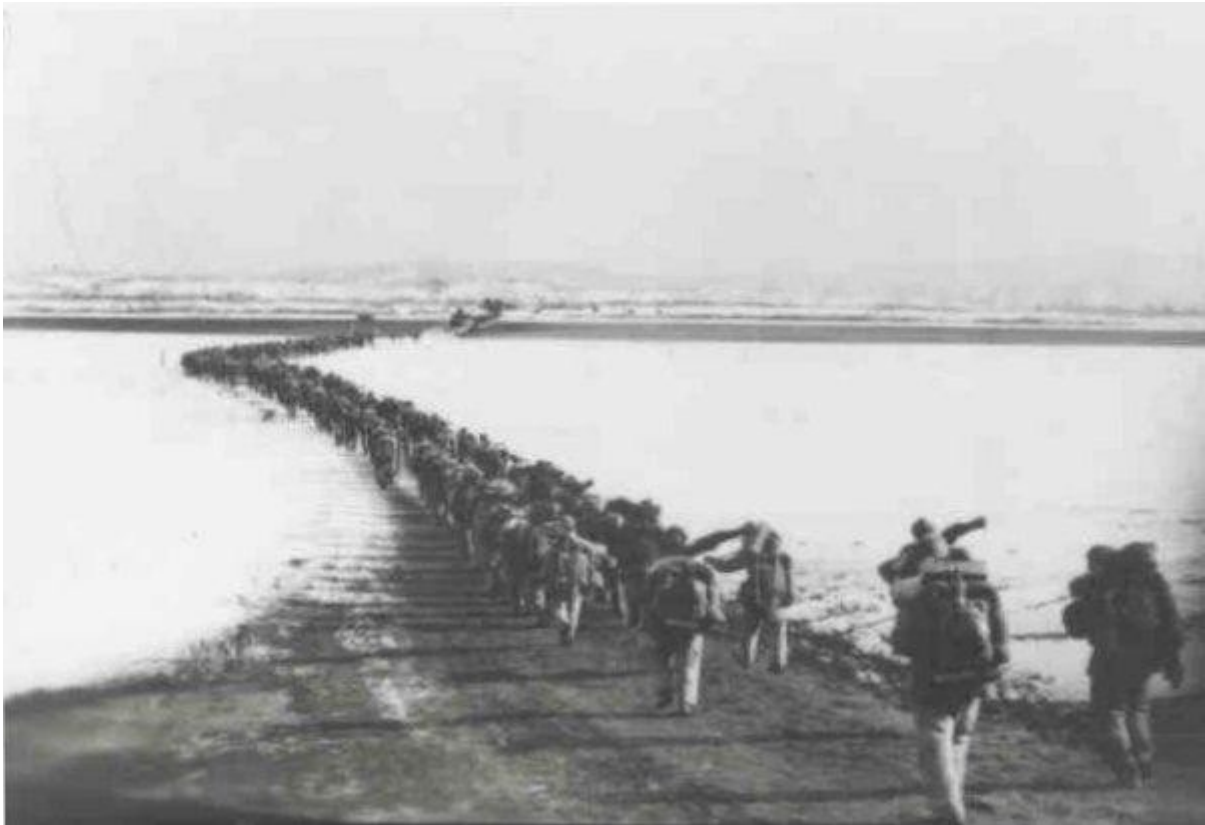
Slika 10: Prečkanje reke Jalu

»Osma faza« je trajala samo dva dni – od 24. do 26. novembra 1950 – torej od začetka ofenzive sil OZN do začetka protiofenzive korejsko-kitajskih sil 27. novembra 1950. MacArthur je v ofenzivo poslal 8. ameriško armado, ki so jo sestavljali 3 korpusi. Cilj ofenzive pa je bila obmejna reka Jalu.