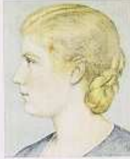
Seitenansicht einer Frau mit hellen, lockigen Haaren, hoher Stirn, breiter Nase.