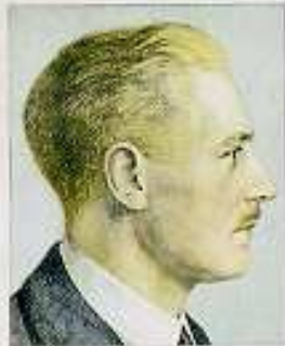
Seitenansicht eines Mannes mit hellen, lockigen Haaren, blondem Gesicht, hoher Stirn, breiter Nase.