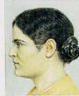
Seitenansicht einer Frau mit dunklen, lockigen Haaren, dunklem Gesicht, hoher Stirn, breiter Nase.