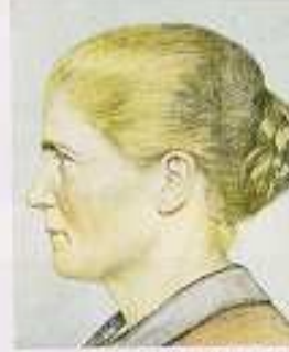
Seitenansicht einer Frau mit hellen, lockigen Haaren, hoher Stirn, breiter Nase.