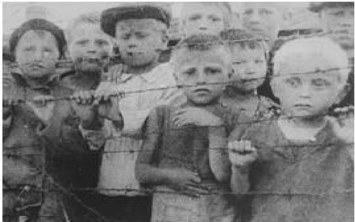
Polish children who will be sent to live in Germany