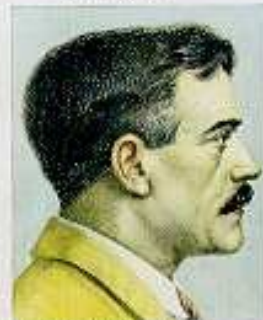
Seitenansicht eines Mannes mit dunklen, lockigen Haaren, dunklem Gesicht, hoher Stirn, breiter Nase.