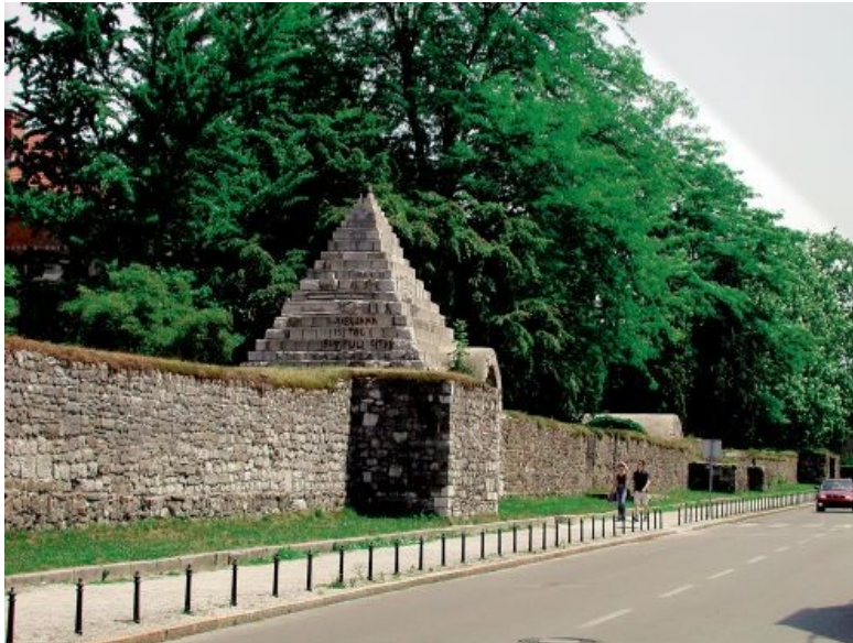
Slika 4 Rimski zid na Mirju

Florisno podobo mesta, ki se je oblikovala po nešteti drugih rimskih mestih- Julija Emona, so rekonstruirali številni arheologi in arhitekti. Na severni in zahodni strani obzidja sta Emono varovala dva obrambna jarka, napolnjena z vodo. Arheološka odkritja leta 1965 so ovrгла domnevo, da je jarek obdajal celotno obzidje, saj je na vzhodni strani varoval le glavna mestna vrata. Ko je bilo mesto razdejano so ruševine zasule ves severen in jugovzhodni del jarka. Mestno obzidje, ki je obdajalo in varovalo mesto je bilo široko 2,5 m in visoko od 6 do 8 m. Zgrajeno naj bi bilo okoli leta 14 n.št., v pravokotni obliki z 26 obrambnimi stolpi in štirimi glavnimi vrati. Najbolj ohranjen del obzidja danes stoji na Mirju, in predstavlja del zahodno od južnih vrat. Vidna je celo notranja struktura. Zaradi varnostnih ukrepov ob vpadih barbarov so Rimljani stranska vrata v antiki zazidavali. In ena od takšnih so ohranjena tudi na Mirju. V 30. letih 20. st. so bile mestne utrdbe obnovljene po načrtih Jožeta Plečnika.