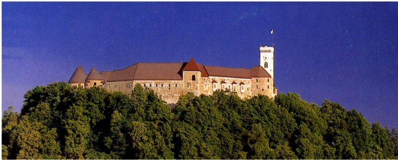
Slika 7 Ljubljanski grad

Jurija je bil celoten grad predelan v 16. in 17. st. Bil je uporabljen v funkciji vojaške postojanke in tudi deželnega zapora-V 19. st so mu dodali še razgledni stolp, s katerega je čuvaj lahko opazoval dogajanje v mestu. Leta 1905 je mestna občina kupila grad za kulturne namene a do 1964 je služil kakor stanovanjski kompleks .Nato se je začela prenova grajskih stavb. Danes je privlačna atrakcija, prizorišče kulturnih prireditev, koncertov, predstav, razstav in daje poseben pečat utripu mesta.