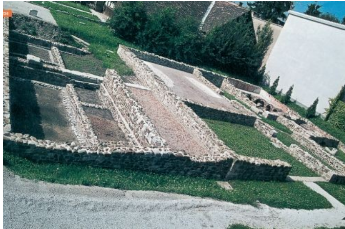
Slika 5 Jakopičev vrt

Forum oziroma osrednji pravokotni trg antične Emone je bil javno, poslovno in kulturno središče mesta, ki je stal na križišču današnje Slovenske in Rimske ceste. Tam so odkrili ostanke svetišča Jupitru, Junoni in Minevri, mestno posvetovalnico-kurijo in sodno dvorano-baziliko. V antičnih časih so bili navadno na forumu postavljeni tudi kipi cesarja in pomembnih meščanov in objavljeni državni zakoni in dekreti. Danes na tem območju stoji stanovanjska soseka Ferantov vrt, v Jakopičevi dvorani pa je mogoče videti ostanke upravnega centra, med njimi del bazilike in obod valjaste stavbe.