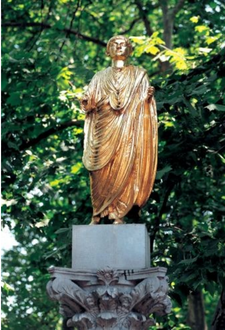
Slika 6 Emonec

Na prostoru Trga republike je nekdam stalo severno obzidje Emone. Del originalnega zidu je še vedno ohranjen v podhodu, pod Maximarketom. Na tem območju so v antiki stale štiri stavbe, najzanimivejše ostanke pa so arheologi našli v ostanku insule – večnadstropnega stanovanjskega bloka iz 1.st.n.št., ki je v sebi skrivala srebrnike, bronaste kovance in celo en zlatnik mladega Nerona ter Jupiterjev oltar, postavljen v 3.st.n.št. Vse najdbe so shranjene v Mestnem muzeju Ljubljana.