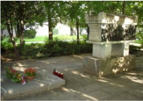
Slika 9 Grobnica herojev

Grobnica narodnih herojev stoji v Ljubljani, v spomin padlim vojakom Narodno osvobodilnega boja-NOB, ki je bil oboroženi boj Osvobodilne fronte proti fašističnim in nacističnim oblastem. Grobnica sama je postavljena pod zemljo, ob njej pa je spomenik v obliki sarkofaga. Postavljena je bila leta 1949. Na zahodni in vzhodni stranici sarkofaga sta bronasta reliefa z prizori iz boja. Grobnico sta oblikovala in naredila arhitekt Edo Mihavec in kipar Boris Kalin. Leži zraven zgradbe državnega zbora, pred Narodnim muzejem Slovenije.