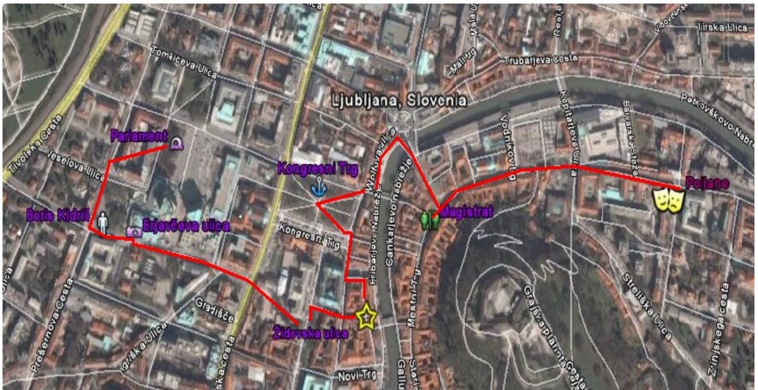
Slika 1: Zemljevid naše poti

Na ekskurziji po Ljubljani smo se ustavili na več krajih, ob spomenikih, ki predstavljajo neko znamenitost Ljubljane, kot mesta, ki ga vsi poznamo. Ljubljane, takšne, kakor je danes, ne bi bilo brez vseh teh znamenitosti in dogodkov, ki so se dogajali v preteklosti. Že od daljne zgodovine je Slovenija, kot ozemlje in Ljubljana, Laibach, Luvigana oziroma Emona, kot središče tega ozemlja, predstavljala pomembno prometno in trgovsko križišče ustaljenih prometnih tokov med severno in južno ter zahodno in vzhodno Evropo. Že od pradavnine je bila zaradi tega privlačna za poselitev, to pa je spodbudilo razmah družbe in kulture. Tako drži v sebi mnogo ostankov različnih kultur in civilizacij. Naš sprehod skozi Ljubljano in njeno zgodovino je potekal vse od rimskih časov do konca druge svetovne vojne. Ustavili smo se prvo pred Poljanami, Magistratom nato smo šli čez Zmajski most do Kongresnega trga, kjer smo nadaljevali pot z postojankami na Židovski in Gosposki ulici do Erjavčeve ceste in naše zadnje postojanke pred parlamentom.