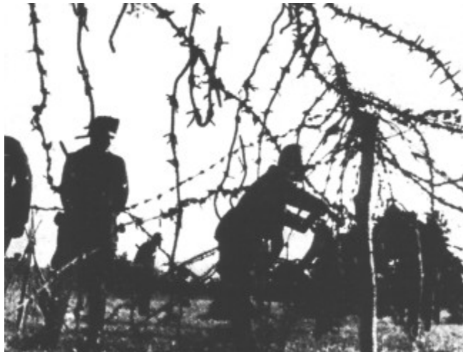
Slika 8 Postavljanje bodeče žice okoli Ljubljane

Ljubljana je bila na začetku zelo aktivna v uporabi proti okupatorju. Partizanske, obveščevalne in propagandne dejavnosti so imele v mestu razne ilegalne oddelke, npr. tiskarskega, radijskega(Kričač), dokumentnega...Delovale so skrivne tiskarne, ki so tiskale časopise, publikacije in tudi razne delavnice. Osvobodilna fronta je izbrala zahodni del Gorenjske za poveljstvo slovenskih partizanskih čet in narodnoosvobodilnega gibanja, hotela tam povzročiti vstajo in osvoboditi ozemlje. V Ljubljani je tako delovala tudi mobilizacijska komisija, ki je skrbelo za prehod v OF. Da bi preprečili beg komunistov in pristašev Osvobodilne fronte iz mesta v narodnoosvobodilno vojsko in mesto zaprli pred njenimi vplivi je italijanska vojska čez noč med 22. in 23. februarjem obdala Ljubljano z obročem bodeče žice in ta položaj do poletja še bolj utrdila z žičnimi ovirami in bunkerji.