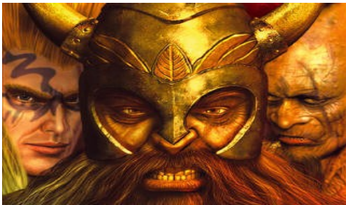
Slika 3 Barbari

Strateški pomen slovenskega ozemlja se je povečal v 3.st., saj je postalo prizorišče spopadov med krščanskim Vzhodnim in poganskim Zahodnim delom rimskega imperija, poleg tega pa je bilo prehodno območje, na poti v Italijo, za tuja ljudstva, ki so bila željna plena in zemlje. Prav tako je konec 3.st. zaradi pritiska Germanov razpadel obrambni sistem ob Renu in Donavi. Germani so hoteli rodovitna območja rimske države, njihovo preseljevanje pa so sprožili Huni, ki so prišli iz Azije in se naselili v Panonski nižini. Od tam so pod vodstvom vladarja Atila vdiral čez naše ozemlje v Italijo, saj so hlepli po bogastvu. Zahodnorimska država je poskušala zadržati Hune, Gote in druge barbare. Vendar pri tem niso bili preveč uspešni, saj so vedno številnejša plemena vdiral skozi slovensko ozemlje v Italijo, kar je kmalu povzročilo razpad rimskega imperija. Emone so, po hudih udarcih, na poti v Italijo opustošili Huni, po čemer si mestece ni več opomoglo.