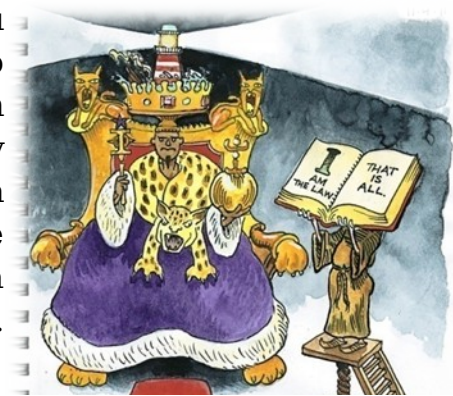
Slika 3: »I am the law. That is all.« (Jaz sem zakon. To je vse.) (23.4.2015)

V času vladanja Ludvika XIV. je pomen absolutističnega vladanja dosegel vrh. Vsem je poznan njegov izrek: »Država, to sem jaz!«