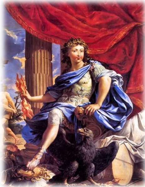
Slika 7: Ludvik XIV. leta 1655 (23.4.2015)