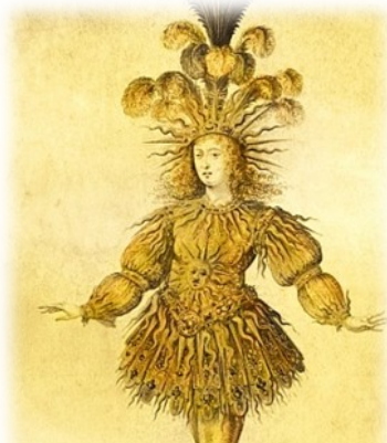
Slika 9: Ludvik XIV. kot v Baletu noči (vloga Sonca) (23.4.2015)