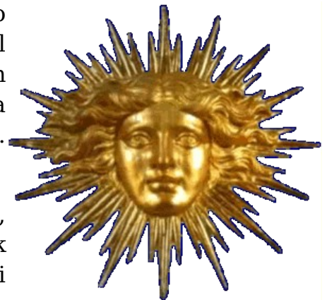
Slika 1: Vkovan obraz Ludvika XIV. v podobo sonca (23.4.2015)

izvajalce svojih ukazov , ki so se zavedali, da si bodo z nedoslednim upoštevanjem vladarjevih načel zagotovili le neplačilo, želje samih pa so bile usmerjene k nasprotnem - plačilu. ( Spletna stran 1 )