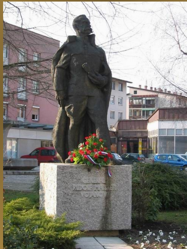
in v Ljubljani.