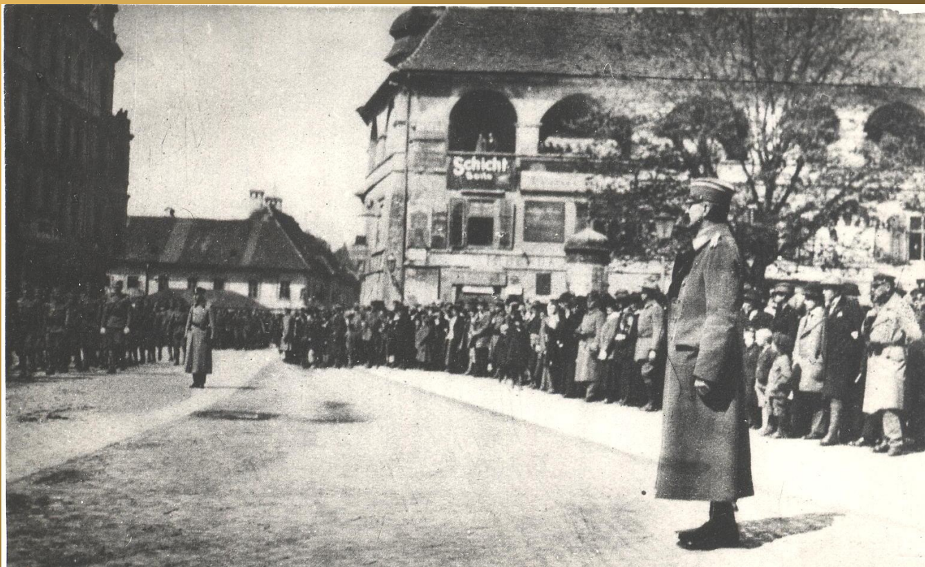
General Rudolf Maister spremlja mimohod svojih čet pred mariborskim gradom ob proslavi zedinjenja 15. decembra 1918.