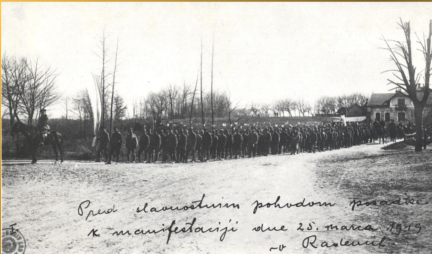
Borci za severno mejo 25. marca 1919 v Radencih.