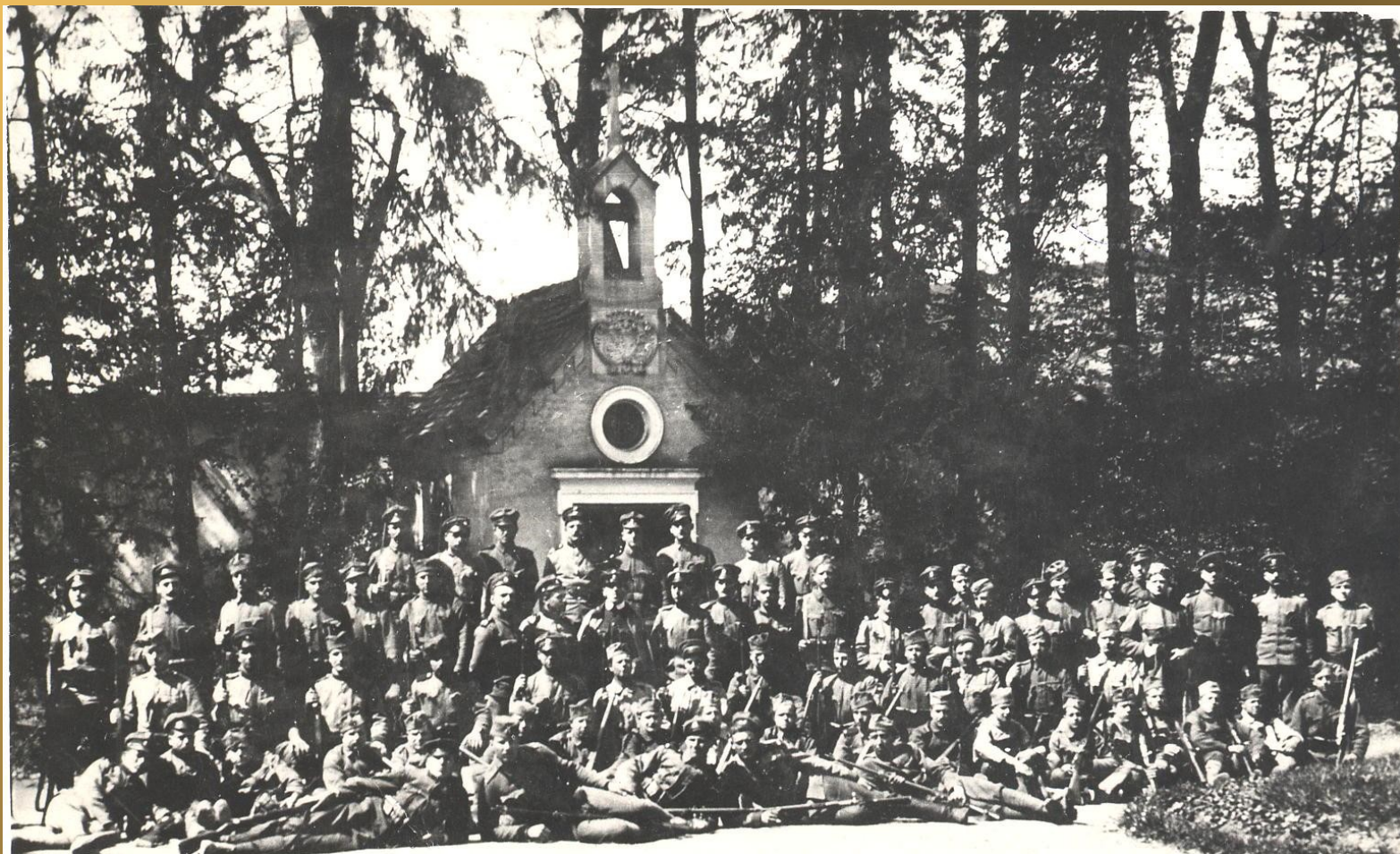
Ena izmed čet Rudolfa Maistra leta 1919 v Špilju.