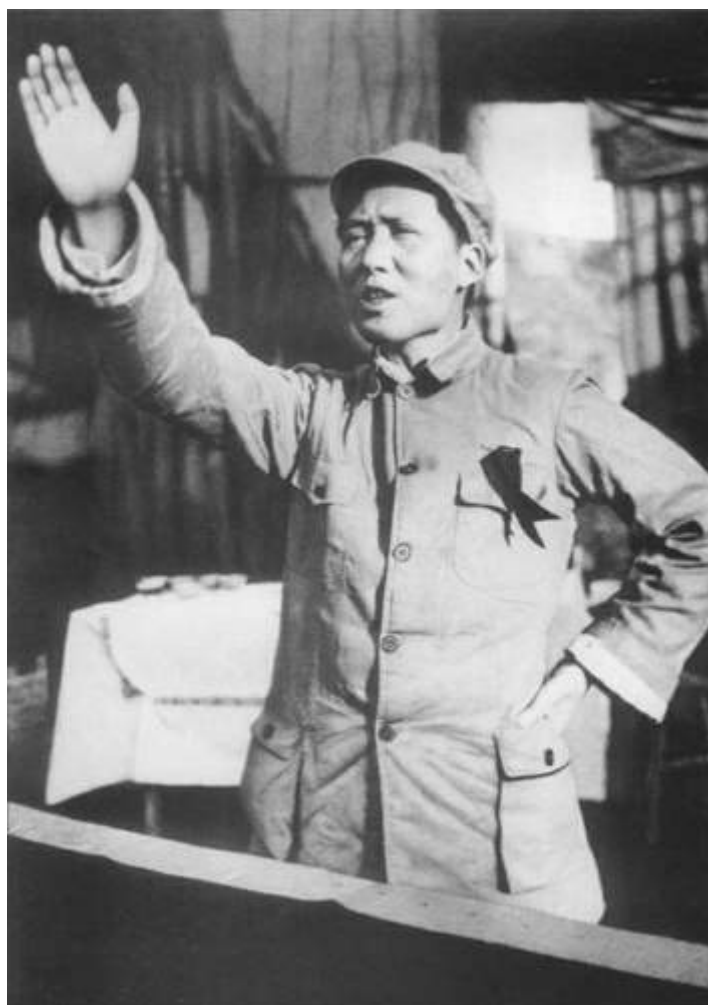
(Mao ima govor- 1939)

Po izbruhu vojne odpora proti Japonski agresiji (1937-1945) se je Mao Cetung na centralni skupščini KKP zavzel za neodvisnost in iniciativa skupne fronte. Tako so mobilizirali množice, izvajali gverilske napade za sovražnikovim ozemljem ter ustanovili velika proti Japonska bazna področja. Večina teh baznih področjih se je nahajalo v goratih predelih severne Kitajske. Med vojno odpora proti Japonski agresiji je objavil nekaj pomembnih del, kot sta "Vpeljava Komunizma" ter "Nova Demokracija".