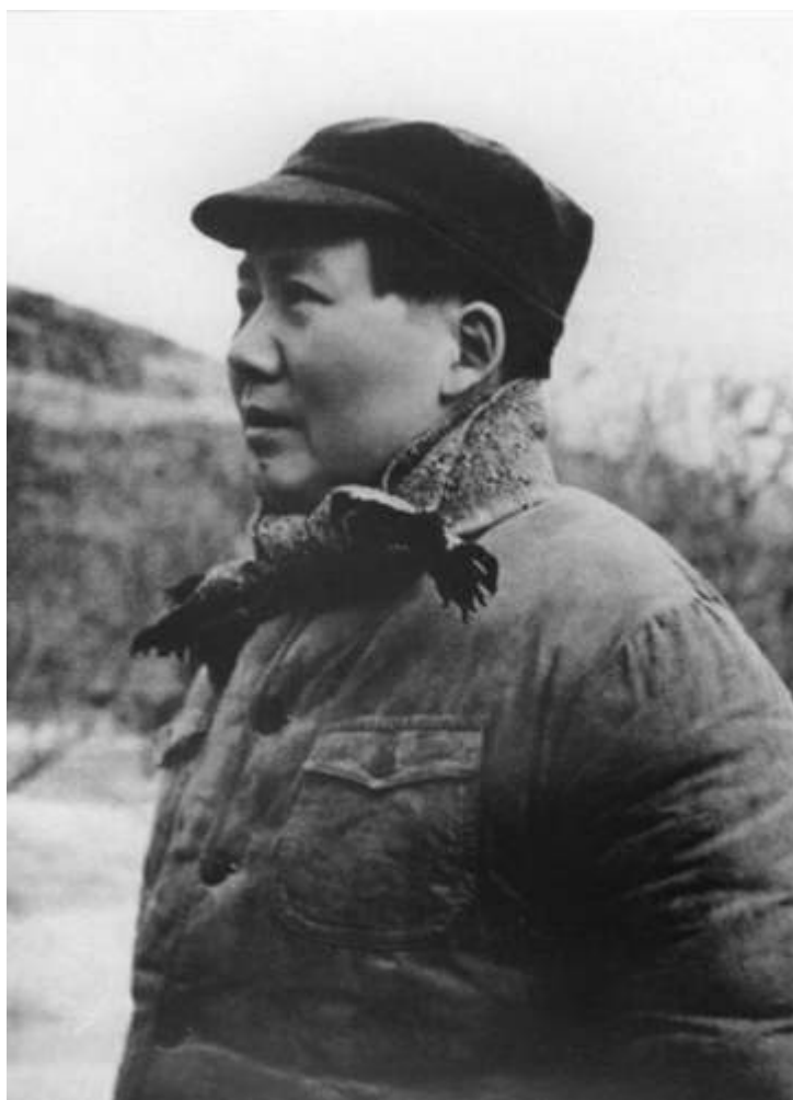
(Mao Cetung - 1946)

Po začetku državljanske vojne leta 1946 je sodeloval z Zhu De ter Zhou Enlai pri usmerjanju ljudske osvobodilne vojske za aktivno obrambno ter mobiliziranje večje vojske za prevlado nad sovražnikovo vojsko. Leta 1947 so prešli iz strateške obrambe v strateški napad. Pod vodstvom Mao Cetunga je ljudska osvobodilna vojska leta 1949 odstavila Kuomintangovo vlado.