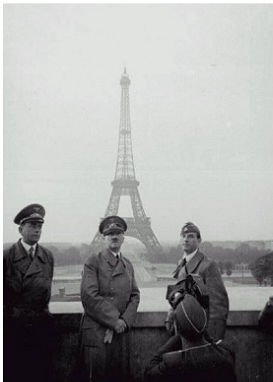
Hitler v Parizu