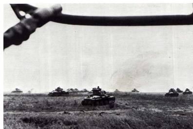
Nemški tanki drvirjo v Francijo