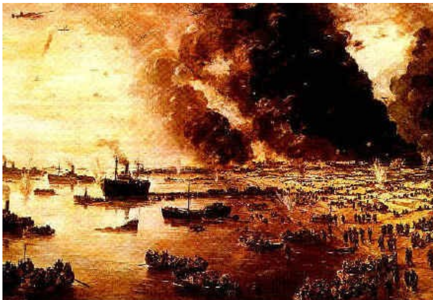
Uničeno mesto Dunkergue

Nemci so obkolili francosko-angleške enote in jih potisnili do morja. Hitler je ukazal uniceenje obkoljene armade z letalstvom. Britanci so organizirali reševanje obkoljenih vojakov in v Dunkerque poslali vsa razpoložljiva plovila. V nekaj dneh so ob nenehnem nemškem topovskem obstreljevanju in letalskih napadih, Britanci z 850 ladjami evakuirali 338000 vojakov in veliko vojaškega materiala. Veliko orožja in kar okoli 1,2 milijona vojakov pa so kljub zavezniškim naporom zajeli Nemci.