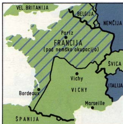
Ozemlje Nemčije ko je kapitulirala Francija