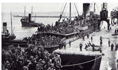
Evakuacija iz Dunkerquea