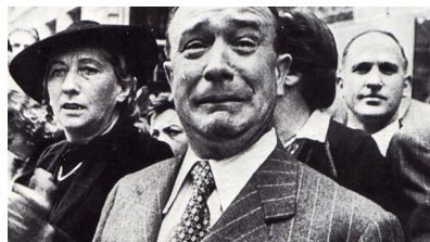
Francozi pričakali Nemce