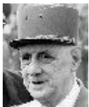
Slika 2: Charlesa de Gaulle

Nekdanje kolonije so postale formalno neodvisne. Kljub temu pa so morale zaradi splošne nerazvitosti in revščine še naprej prisiljene vzdrževati tesne gospodarske in politične stike z bivšimi gospodarji. Gospodarji pa so to obrnili v svoj prid in nato začeli izkoriščati to na gospodarskem in na političnem področju. Nekdanje kolonije so gospodarjem bile še naprej prisiljene prodajati svoje surovine, obenem pa so ostale tržišče za njihove industrijske izdelke.