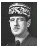
Slika 1: Charlesa de Gaulle

Velika Britanija se je odločila za dokaj mirno pot dekolonizacije. Osamosvojene kolonije je povezala v Britansko skupnost narodov. Ta se je imenovala Commonwealth of Nations. Ta pa še danes gospodarsko, politično in jezikovno povezuje nekdanji kolonialni imperij. Osvobajanje izpod francoske kolonialne oblasti pa je bilo trše. Francozi so svoje posesti enostavno razglasili za del francoske države. Močna osvobodilna gibanja v njihovih kolonijah (predvsem v Alžiriji) pa so prisilila takratnega predsednika Charlesa de Gaulla (glej sliko 1,2), da je priznal njihovo neodvisnost. Najbolj krvav dekolonizacijski proces je potekal v kolonijah manjših kolonialnih sil, zlasti Portugalske. Njeni koloniji Angola in Mozambik sta se osamosvojili šele leta 1975 po večletnem oboroženem boju.