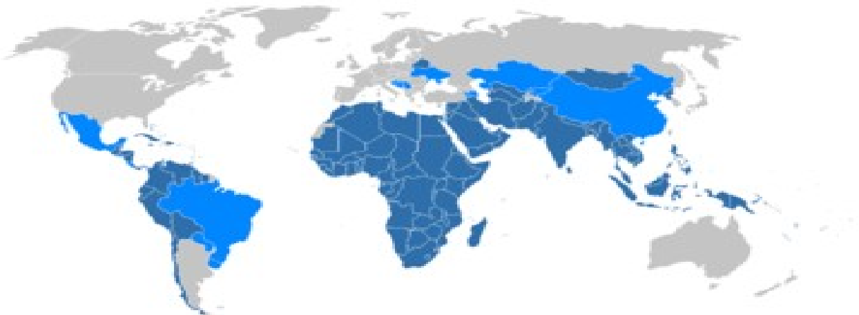
Slika 4: Članice gibanja neuvrščenih leta 2005