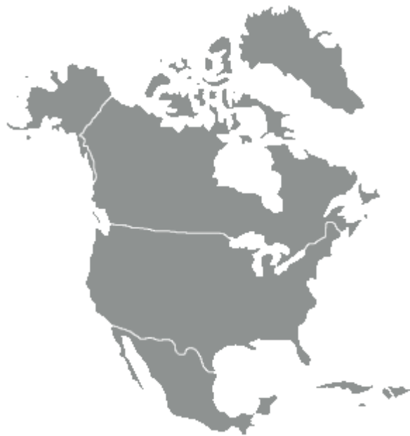
Slika 1: Severna Amerika

Z geografskimi odkritji in osvajanji so si nekatere evropske države pridobile velik vpliv v Novem svetu. Ozemlja so postala njihove kolonije katere so izrabljale za pridobivanje surovin in proizvodnjo blaga za evropski trg. Vladarji teh evropskih držav so si podredili privotno prebivalstvo in jih izrabljali kot delovno silo. Prisiljeni so bili sprejeti nove državne sisteme, bogove, jezik in kulturo. Ti vladarji so v kolonijah širili tudi suženjstvo, ki ga v Evropi niso več poznali.