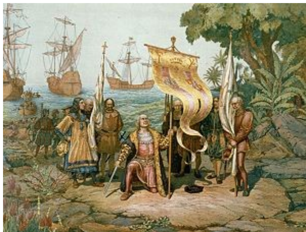
Slika 2: Prihod Krištofa Kolumba v Ameriko

Odkril jo je Krištof Kolumb in sicer po naključju, ko je iskal novo pot do Indije. Do smrti prepričan, da je prispel v Indijo je tamkajšne prebivalce poimenoval Indijanci. Španski in portugalski osvajalci so jo hitro odkrivali in osvajali. V Severni Ameriki so živela indijanska plemena, ki so se med seboj razlikovala po kulturi, jeziku in načinu življenja. Večina teh plemen je bila miroljubna, obstajala pa so tudi roparska (npr. Apači). Od začetka 17. stoletja odkrivajo predvsem angleški, francoski in nizozemski raziskovalci. Med njimi so najbolj znani Henry Hudson, Jacques Cartier, Robert Cavelier de la Salle in Samuel de Champlain. Odkrili so Velika jezera, Niagarske slapove, Skalnega gorovja, velikih rek. Odkrivali so tudi Kanado. Evropski naseljenci so ustvarjali svoje naselbine na vzhodni obali. Leta 1622 Nizozemci na Manhattnu postavijo trgovsko središče, ki so ga poimenovali Novi Amsterdam (ko ga prevzamejo Angleži, ga preimenujejo v New York). Zaradi gospodarskih interesov prihaja do vojn med evropskimi osvajalci. V 18. stoletju uspe Angliji odvzeti Franciji večino posesti v S. Ameriki in sicer Novo Fundlandijo, Novo Škotsko in Kanado.