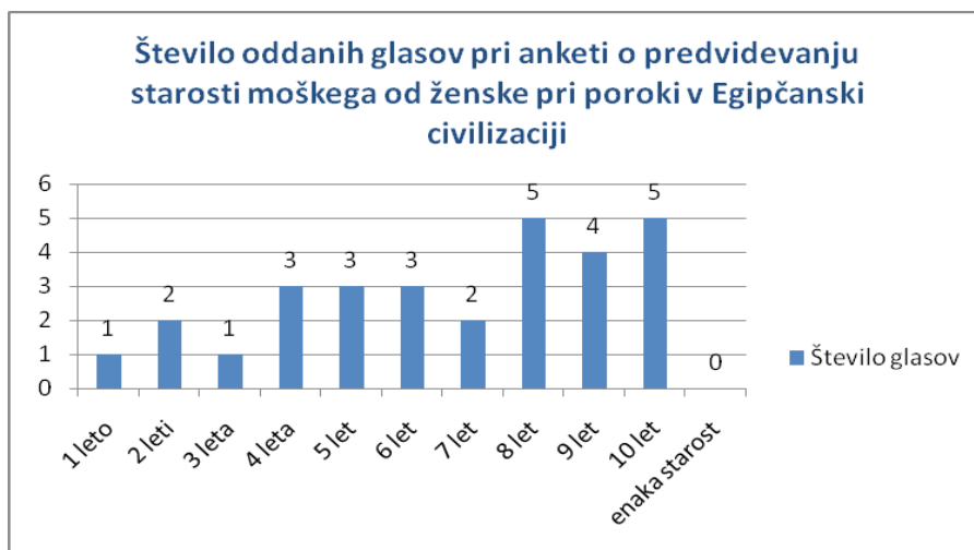
Grafikon 1: Število oddanih glasov pri Anketi o predvidevanju starosti moškega od ženske pri poroki v Egipčanski civilizaciji