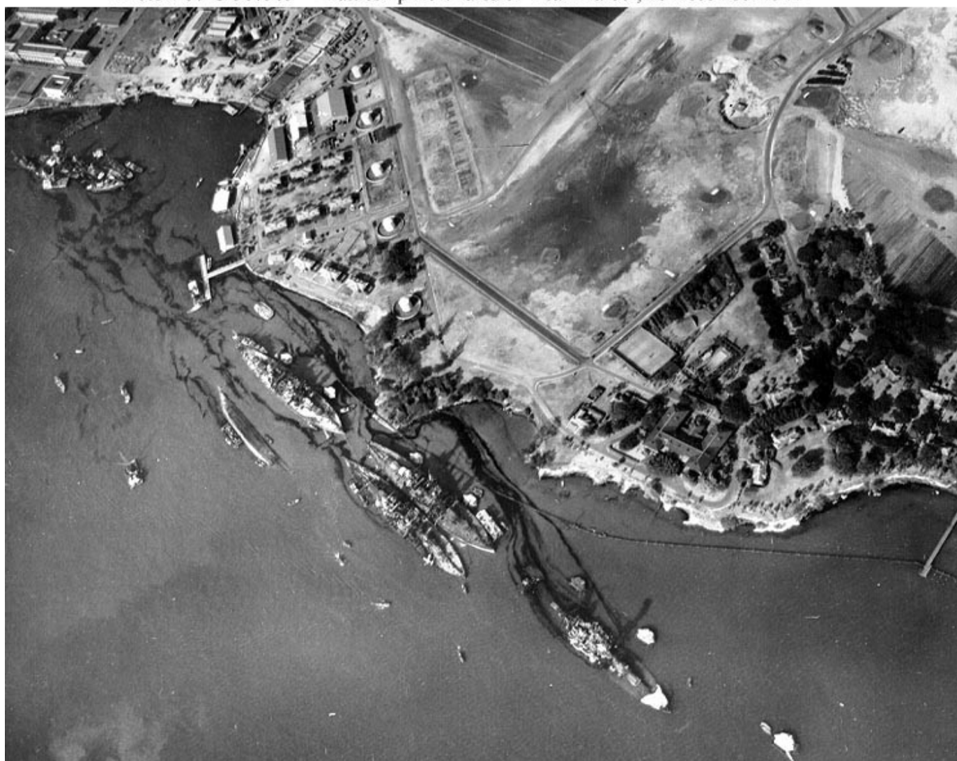
Photo # 80-G-387565 "Battleship Row" area of Pearl Harbor, 10 December 1941

V začetku 1940 so se odnosi med ZDA in Japonso močno poslabšali, saj je Japonska začela priključevati ozemlje Kitajske brez odobritve ZDA in evropskih kolonialnih sil, ko pa so Japonske čete zavzele Francosko Indokino, je Amerika odločila zaračunati embargo na uvoz goriva. To je pomenilo, da niti Nizozemska ni smela dovajati goriva katero je bilo potrebno Japoncem za obstoj v vojni. Japonci se niso hoteli umakniti iz ozemlja Kitajske in vojna je bila neizbežna.