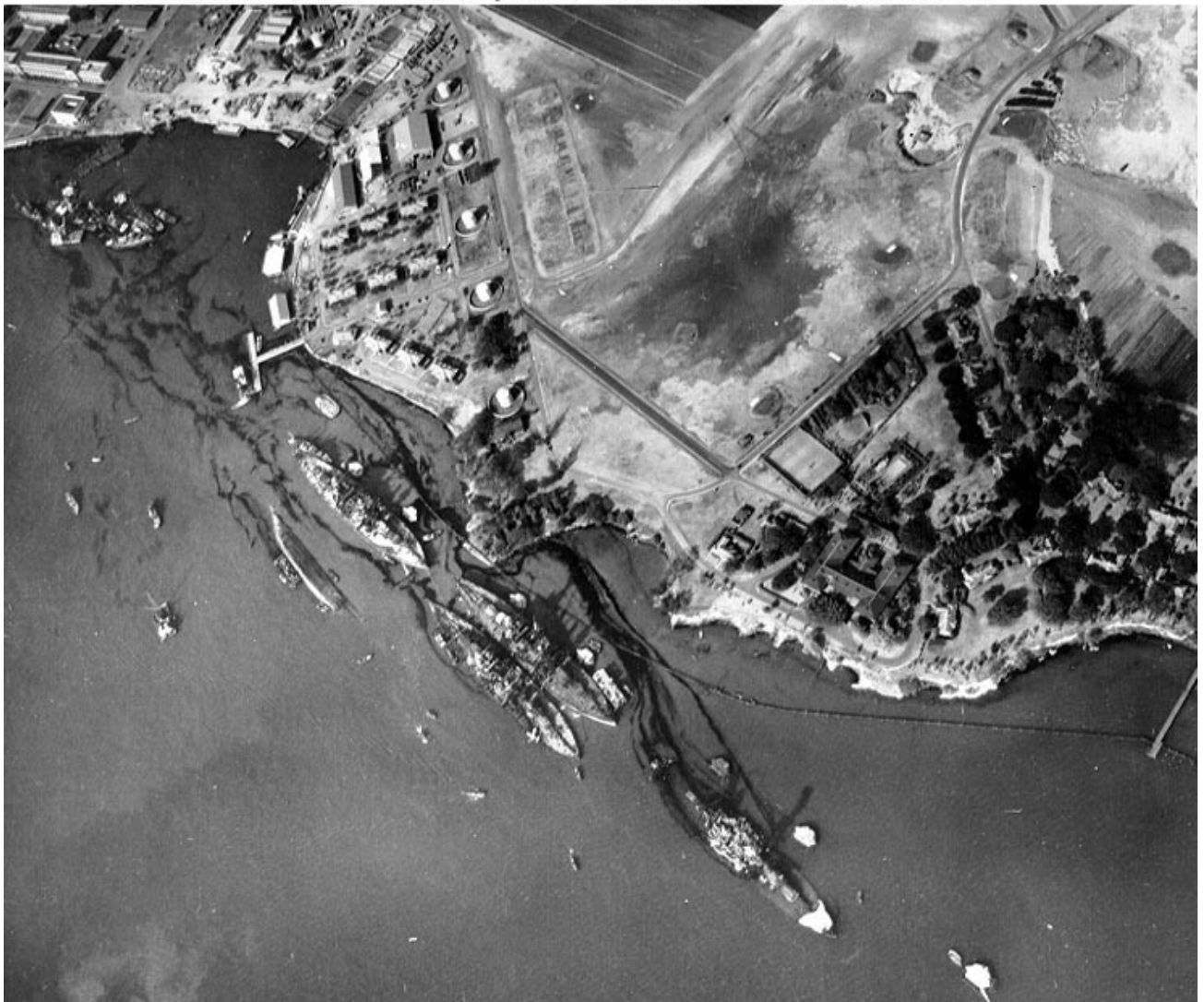
Photo # 80-G-387565 "Battleship Row" area of Pearl Harbor, 10 December 1941

V začetku 1940 so se odnosi med ZDA in Japonso močno poslabšali, saj je Japonska začela priključevati ozemlje Kitajske brez odobritve ZDA in evropskih kolonialnih sil, ko pa so Japonske čete zavzele Francosko Indokino, je Amerika odločila zaračunati embargo na uvoz goriva. To je pomenilo, da niti Nizozemska ni smela dovajati goriva katero je bilo potrebno Japoncem za obstoj v vojni. Japonci se niso hoteli umakniti iz ozemlja Kitajske in vojna je bila neizbežna.