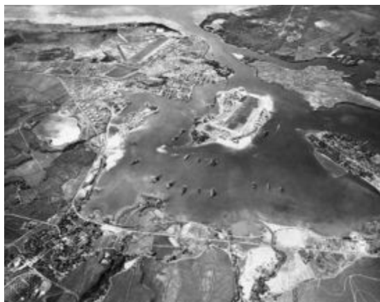
Slika 2: Pearl Harbor 30. oktobra 1941