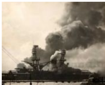
Slika 5: Goreča USS Nevada med pobegom iz oporišča.