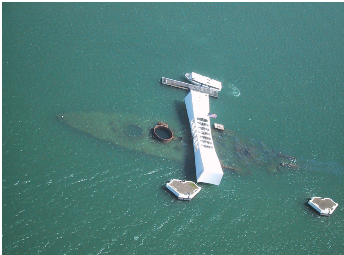
Slika 9: Spominski pomol, ki so ga postavili v čast žrtvam na USS Arizona.

Po napadu je bila ameriška udarna moč na Tihem oceanu začasno ohromljena. Tokijski časopisi so pisali, da so se ZDA znašle v položaju tretjerazredne sile. Ko je ameriško ljudstvo zvedelo za napad, je bilo neverjetno presenečeno. Dan po napadu je imel Roosevelt v kongresu znameniti govor po katerem je bilo glasovanje za ali proti vojni. Senat je enotno glasoval za vojno in tako zahteval uničenje Japonske. Tri dni pozneje sta Nemčija in Italija napovedali vojno ZDA, zaradi česar je kongres sprejel skupno resolucijo s katero je sprejel vojno stanje, ki so ga vsilili ZDA. Vojna, ki je bila do takrat bolj ali manj stvar Evrope je tako postala svetovna. Japonci so po napadu na Pearl Harbor napadli še Hong Kong, Malajo, Nizozemsko vzhodno Indijo, Filipine, Novo Gvinejo, Guam, Otok Wake in nekaj Aleutskih otokov. Britanske, ameriške in nizozemske postojanke so padale ena za drugo, nihče ni moral vstaviti nezadržnega japonskega napredovanja. Prva polovica leta 1942 je bila za zaveznike na območju Tihega oceana prava katastrofa, vendar pa se je vojna sreča po bitki v Koralnem morju in bitki za Midway, kmalu postavila na stran zaveznikov.