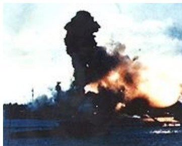
Slika 6: Eksplozija streliva na USS Arizona.

Predviden je bil še tretji napad letal, vendar pa do njega ni prišlo, saj je bil admiral Nagumo prepričan, da sta prva dva napada naredila dovolj škode. Poleg tega pa tretji napad ne bi bil več nobeno presenečenje, saj bi ga Američani pričakali z vsem orožjem, ki bi ga imeli, vključno z manjkajočimi letalonosilkami, zato se je Nagumo odločil, da je napada konec, svoje ladjevje pa je obrnil proti domu.