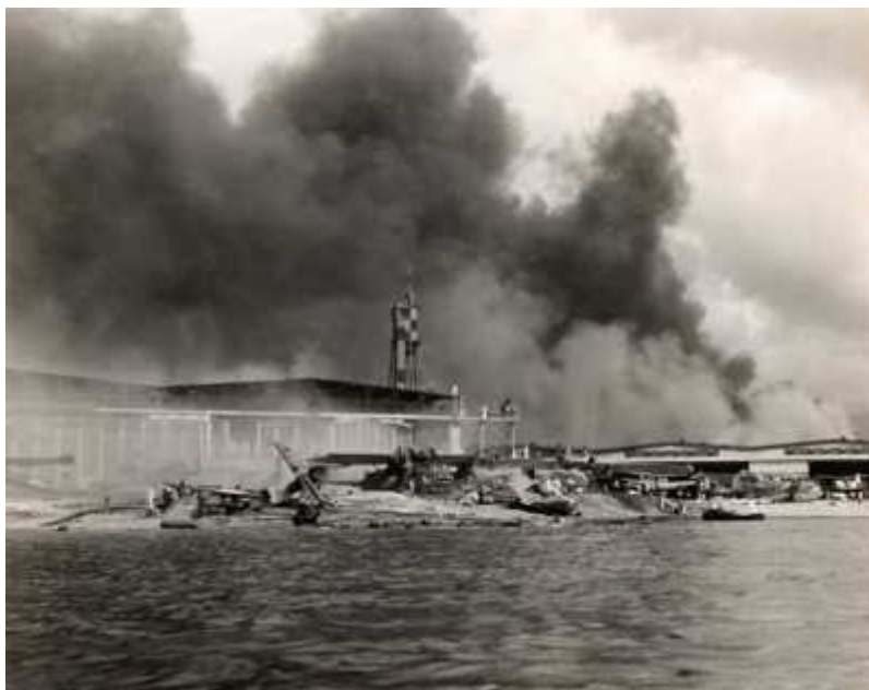
Slika 1: Uničeno oporišče.