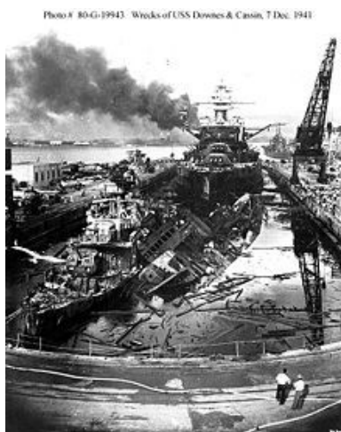
Slika 8: Uničeno ameriško ladjeve.