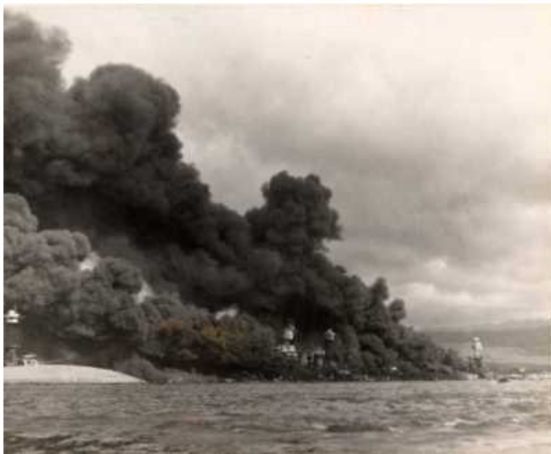
Slika 4: Bojne ladje v plamenih.

Med tem ko je proti Havajem plulo japonsko ladjevje so v Tokiu sestavljali osnutek končnega sporočila ZDA, ki naj bi ga veleposlanik Nomura izročil Washingtonu v nedeljo 7. decembra natanko ob 13.00. Takrat na bi bila ura na Havajih 7.00, kar je pol ure pred predvidenim napadom. Ameriška obveščevalna služba je prestregla sporočilo namenjeno japonskemu veleposlaniku in ga nemudoma posredovala predsedniku Rooseveltu. Ta je dejal; »To pomeni vojno«. Navodilo Nomuri, da naj sporočilo odda natanko ob 13.00 je bilo za obveščevalno službo namig, da Japonci nekaj pripravljajo. Svoje ugotovitve je posredoval načelniku generalštaba kopenske vojske Marshallu, kar je povzročilo določen časovni zamik saj je bil ta zaradi jahanja do 11.30 nedosegljiv. Po opravljeni rekreaciji je ta nemudoma pripravil sporočilo vsem tihomorskim enotam, prednostno so ga dobili Filipini, ki pa ga je bilo potrebno pred pošiljanjem šifrirat saj Japonci niso smeli izvedeti, da so Američani razbili njihovo šifro, s tem pa so izgubili dragoceni čas. Tako je general Short, poveljnik kopenske vojske na Havajih, svoj izvod opozorila dobil šele po napadu.