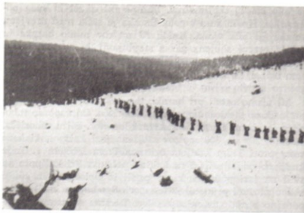
( Okupatorjeva kolona na pohodu v bližini Velikega vrha )

Nemci so poskušali neprestano izslediti bataljon, ki jim je bil trn v peti, saj je deloval na območju t.i. tretjega rajha. Drugega Prosinca 1943 so vohuni sporočili Gestapu v Maribor, kje ima Pohorski bataljon svoj tabor. Nemci so pričeli pripravljati veliko akcijo. Šestega Prosinca je bil izdan ukaz za napad. Poklicali so policijske čete iz Krškega, Slovenj Gradca, Šoštanja, Ljubnega in Celja, vojsko iz Laškega, Slovenske Bistrice, Radelj in Slovenj Gradca, vermanšaft iz Celja in Maribora. Naslednji dan je okupator zbral policijo, orožništvo, vojsko in vermanšaft v Mariboru ter v Poljčanah. Od tod je prepeljal enote na izhodiščne položaje v Ruše in v Oplotnico. Osmega Prosinca 1943 je okoli 2.000 mož sovražne vojske obkolovalo bataljonski tabor pri Osankarici. Bataljon ni imel podatkov o sovražnikovi moči. Ni vedel, da ga je napadel tridesetkrat močnejši sovražnik. Junaško je sprejel borbo in padel do zadnjega moža, žene in otroka.