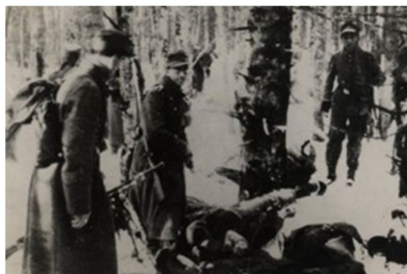
( Nemci si ogledujejo mrtve partizane )