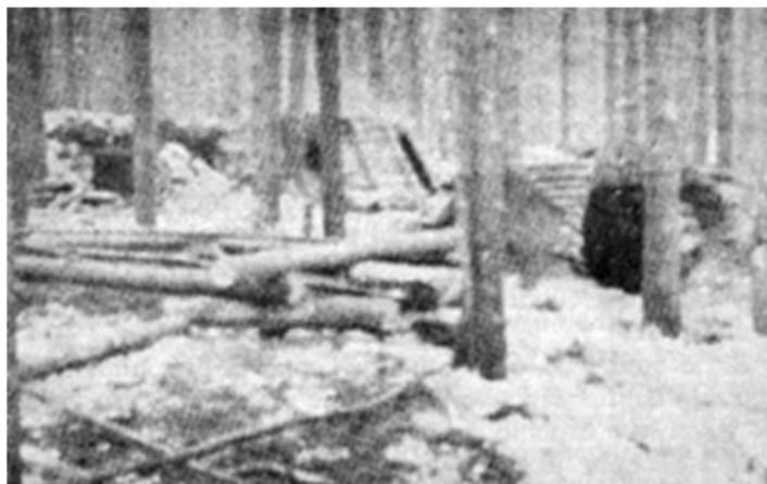
( zadnje taborišče Pohorskega bataljona na Osankarici )