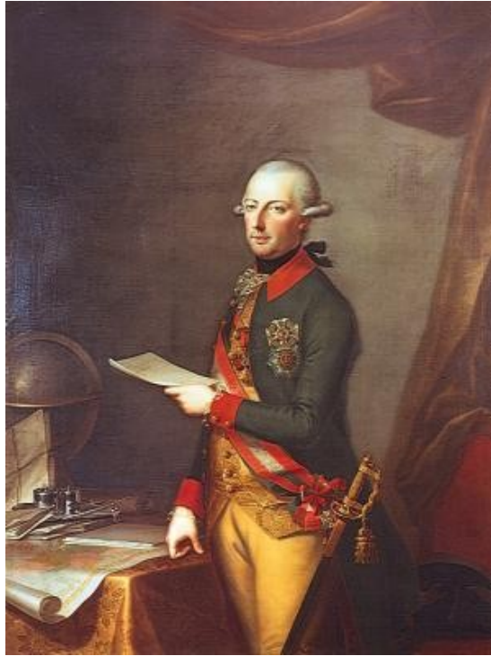
Slika 2: Jožef II.