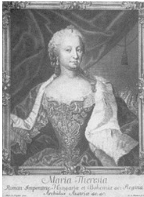
Slika 1: Marija Terezija