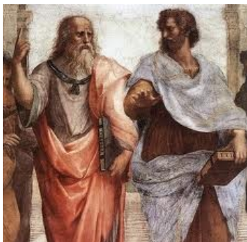
Aristotel in Platon

Potrebno je omeniti dva izjemna retorika Platona (427 – 347 pr. n. št.) in Aristotela (384 – 322 pr. n. št. ), s katerima se končuje razvoj grške retorične teorije. Skoraj vsi Platonovi spisi so napisani v obliki dialogov, kjer nastopa Sokrat v pogovorih z najbolj znanimi filozofi svojega časa. Dialog je bil dokaj razširjena literarno delo. Vendar pa so ohranjeni samo Platonovi dialogi, zato ne vemo, na kakšne teme so bili napisani drugi. Platon je besedovanje med misleci različnih nazorov skušal dvigniti na višjo stopnjo. Menil je, da samo na takšnem skupnem in strpnem umovanju lahko utiramo pot k resnici.