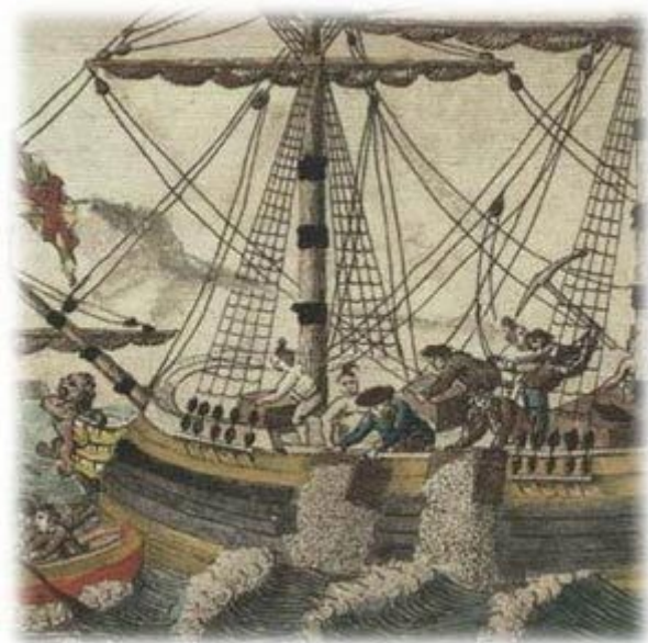
Bostonska čajanka (Ameriška revolucija)

Konec je bil ko je Beneška Slovenija 1805 prišla pod avstrijsko oblast. Ko je bila leta 1813 francoska vojska poražena je bilo konec Ilirskih provinc. Leta 1816 je bila ustanovljena Kraljestvo Ilirija, leta 1849 pa je to kraljestvo v dokumentih izginilo. Nato so Ilirske province spadale med oblast Avstrijcev.