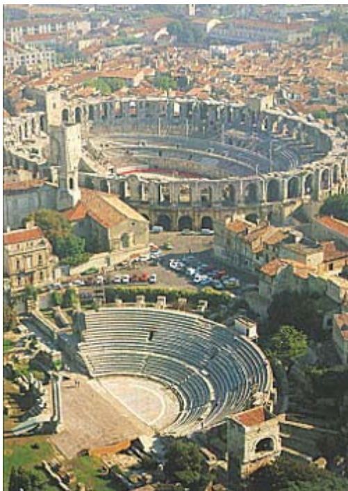
Slika4: Rimsko gledališče in amfiteater v Arles-u

To so bile raznovrstne igre, ki so se ovijale v cirkusu (Circus Maximus, Circus Flaminius) in v amfiteatru (Flavijski amfiteater-Kolosej). Na začetku so cirkuške igre organizirali le ob verskih praznikih, postopoma pa so izgubile svoj prvotni religiozni pomen in se spremenile v politično sredstvo. Z organizacijo razkošnih iger in prireditev so si vladajoči sloji pridobili naklonjenost ljudstva in zadušili njihove namere po upor. Obenem pa so igre uporabljali kot odlično obliko volilne propagande. Najbolj priljubljene so bile dirke z vozovi, kjer so tekmovali z vozovi. Dirke z vozovi so budile rivalstvo tako med lastniki konj kot med razvnetim občinstvom.