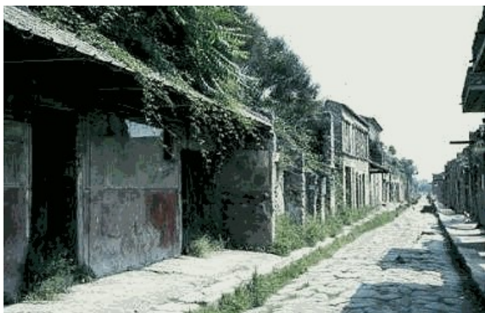
Slika 1: Tipična rimska hiša

Vsi rimski meščani so živeli podobno-tipično življenje rimskega meščana. Rimska mesta so bila zelo naklonjena javnemu življenju in družbeni interakciji, zato so veliko denarja namenili za gradnjo javnih prostorov, kot je forum, kopališče, gledališče... Hiše so spominjale na utrdbo, saj so bile obrnjene proč od ceste, zaradi hrupa. Sobe so bile razporejene okoli odprtega dvorišča oz. atrija.