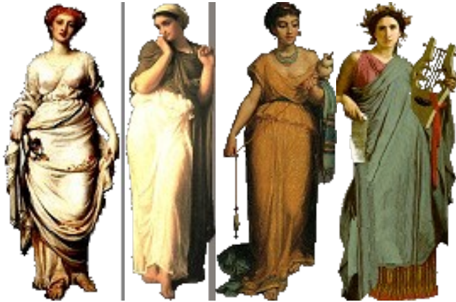
Slika 8: kipi pomembnih rimskih žensk

Glavna delovna sila v Rimu so bili sužnji. To so bili nekoč svobodni meščani, ki so izgubili politične in pravne pravice, ali pa tisti, ki niso mogli plačati dolgov. Največ sužnjev pa je prišlo iz vrst vojnih ujetnikov, ki jih je bilo z osvajanjem Vzhoda (2. stoletje) vedno več. Ti so opravljali poljedelska dela na ogromnih, zaokroženih posestvih (latifundija) in v rudnikih. Zaradi nečloveških razmer, v katerih so bili prisiljeni živeti so se večkrat uprli (predvsem v Južni Italiji), vendar pa so bili žal vsi upori krvavo zadušeni.