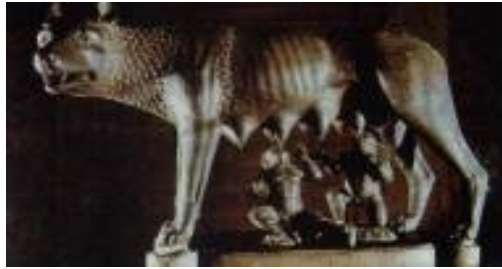
Volkulja doji Romula in Rema

Tradicija povezuje nastanek Rima z grškim svetom - mesto naj bi ustanovil potomec trojanskega junaka Eneja. V kraljevo hčer Silvijo se je zaljubil bog Mars, ki jo je posilil. Rodila je dvojčka Romula in Rema. Kralj Amulij je ukazal naj ju utopijo v Tiberi. Dečkov se je usmilil služabnik, ki ju je položil v košaro in prepustil toku reke. Košara je nasedla na breg, dvojčka je našla volkulja in ju dojila s svojim mlekom. Ko sta Romul in Rem odrasla, sta sklenila, da bosta iz Albe Longe ustanovila novo kolonijo, a se nista mogla odločiti za kraj. Pri tem sta se sporekla in Romul je Rema ubil. Romu je postal kralj.