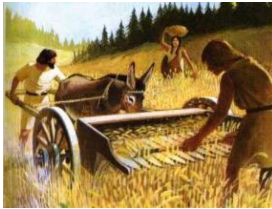
Tipični primer suženjstva