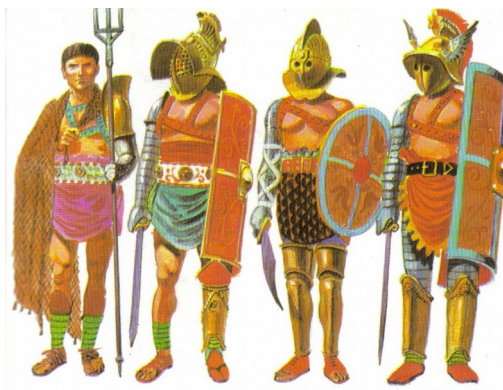
Vrste gladiatorjev: Retiarius, Murmillo, Secutor in Hoplomachus

V arenah so se odvijale bitke med gladiatorji, živalmi in gladiatorji in živalmi in ljudmi ki se niso mogli braniti. Največkrat so to bili Kristijani, sužnji in zaporniki. V areni je bilo prostora za 50,000 gledalcev.