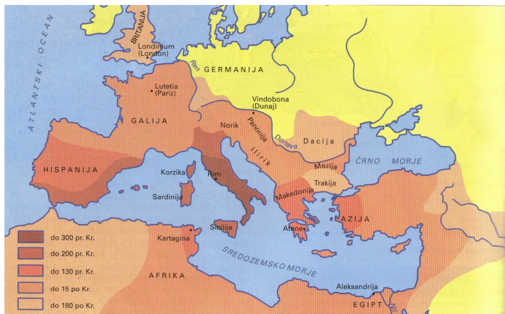
Karta prikazuje širjenje rimske države

V 8. stoletju je ne sedmih gričih (Kapitol, Palatin, Aventin, Kvirinal, Viminal, Eskvilin in Celij), ob reki Tiberi nastalo več naselij, kjer so prebivala različna plamena. Sprva so naseljem vladali etruščanski kralji že tedaj je nastala mestna državica Rim, ki je s pomočjo vojn in s spretnostjo v kasnejših stoletjih zelo razširila svojo oblast. Okoli leta 500 pr. Kr. so prebivalci Rima etruščanskim kraljem odvzeli oblast in razglasili republiko. V naslednjih stoletjih (med 5. in 3. stoletjem) so Rimljani razširili svojo oblast, najprej na vsem apeninskem polotoku.