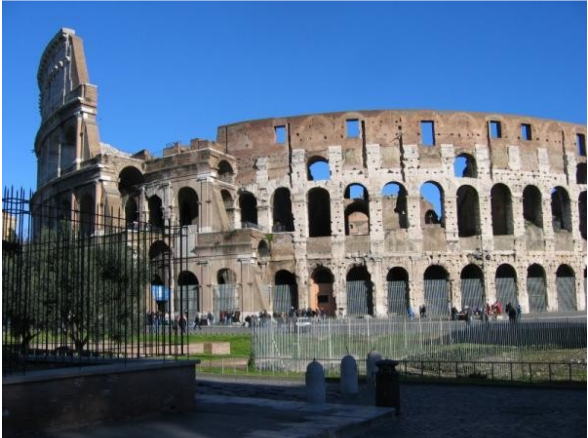
Ostanki arene v Rimu

To temo sem si izbral, ker me zanima zgodovina, še posebno Rim v preteklosti. Italijansko ime Rima je Roma, ki izhaja iz imena Romul, kateri je bil tudi prvi kralj. Rimljani so bili znani predvsem po izredno dobro izurjenih vojaki in po gradbeništvu (akvedukti, arene, ceste...). Poznamo jih pa tudi po njihovih krutih zabavah (gladiatorski dvoboji).