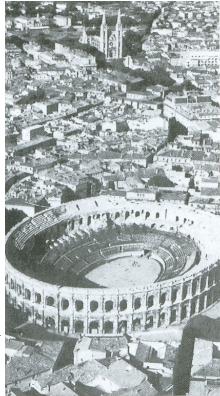
Amfiteater v Nîmesu

Rim je postal kulturno središče Zahoda . Za njegovo privlačnost je s svojimi moralnimi prizadevanji poskrbel še cesar sam. Prepovedal je ločitve in spodbujal nataliteto. Družinam več otroki je dajal posebne privilegije. Oživiljal je starorimski način življenja. Uvedel je staro nošo in obleke.