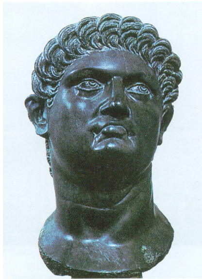
Neron - tiran in hudodelec na cesarskem prestolu

Avrelijan ...). Le 9 jih je umrlo naravne smrti. Orientaliski vplivi v cesarstvu so se še povečali. Nastopila je največja kriza cesarstva doslej. Z vladarji dinastije Severov in vojaškimi cesarji se je končalo obdobje principata v rimski državi.