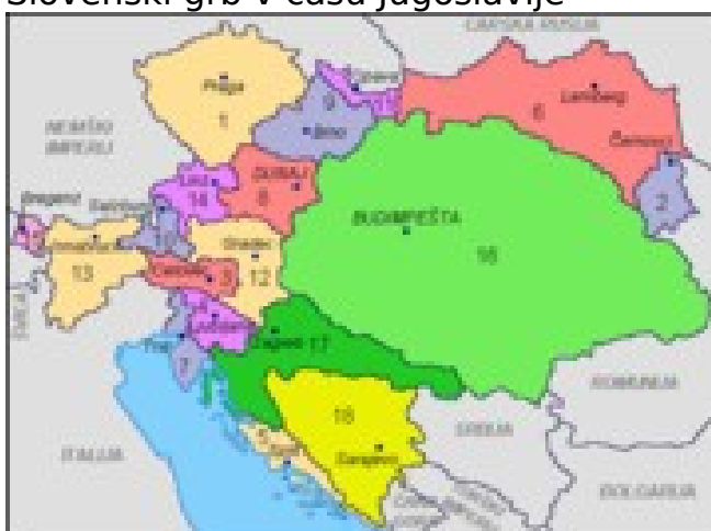
Dežele Avstro-Ogrske po 1867