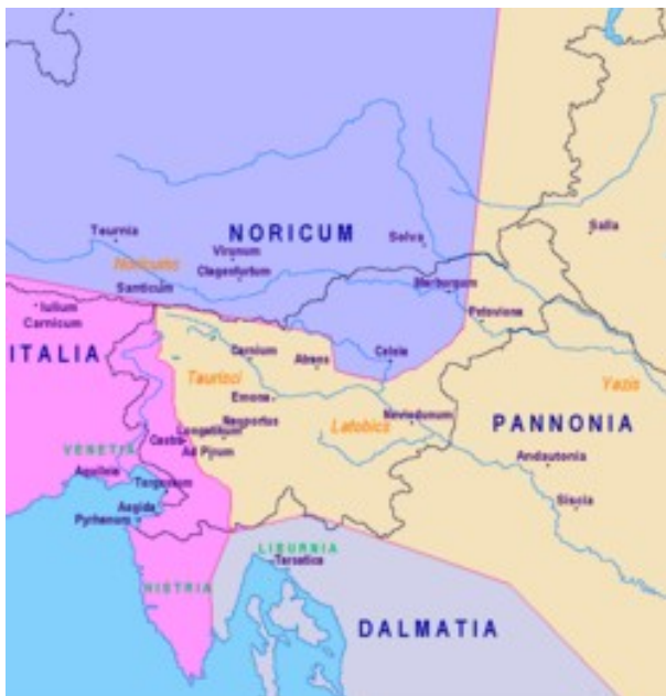
Slovensko ozemlje z rimskimi provincami in mesti.