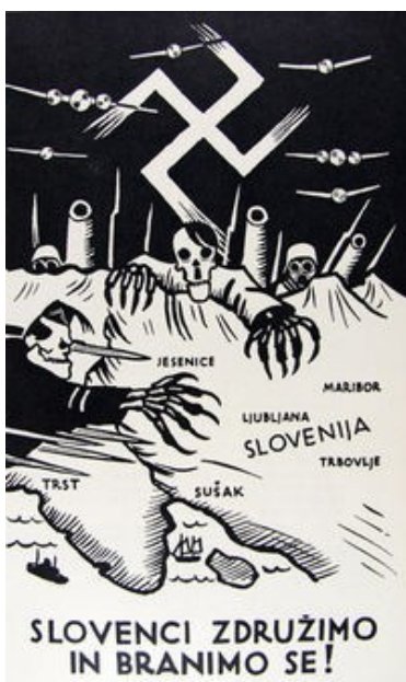
Letak iz leta 1938