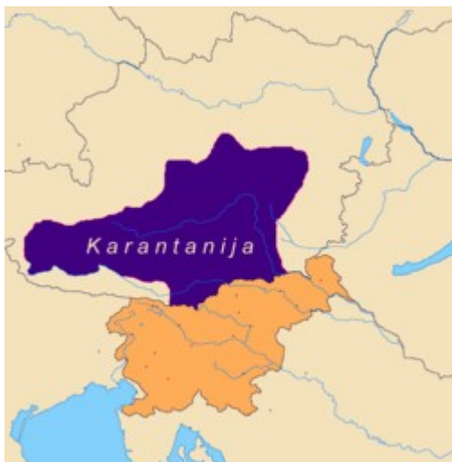
Najverjetnejši obseg Karantanije okrog leta 828