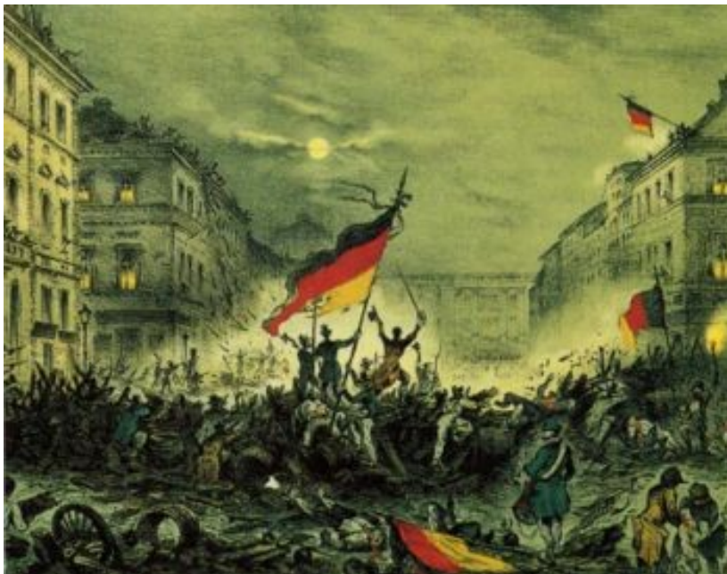
Barikade po izbruhu revolucije v glavnem mestu Prusije, Berlinu

desetdnevni vojni je bilo 7. julija z Brionsko deklaracijo sklenjeno premirje. 18. julija je predsedstvo SFRJ sprejelo odločitev, da se JLA z orožjem in opremo umakne iz Slovenije in oktobra 1991 je odšel iz Slovenije zadnji vojak JLA. Novembra je bil sprejet zakon o denacionalizaciji, decembra pa nova ustava. Evropska unija je Republiko Slovenijo priznala sredi januarja 1992, OZN pa jo je sprejela med članice maja 1992.