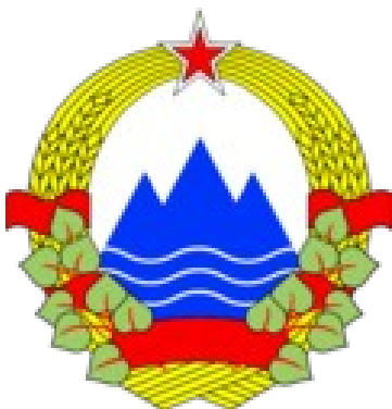
Slovenski grb v času Jugoslavije