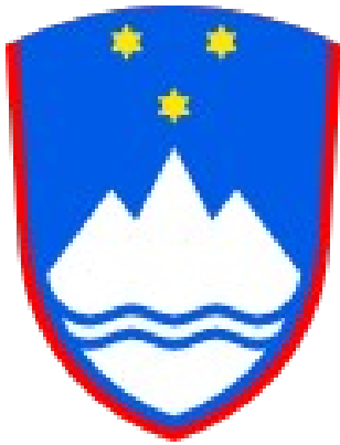
Današnji grb Slovenije