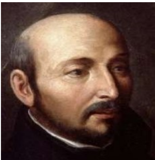
slika1: Ignacij Loyolski

Ignacij Loyolski, nekdanji španski poveljnik, ustanovi Družbo Jezusovo, jezuitski red. Ignacij, ki je bil leta 1521 pri obrambi Pamplone pred Francozi hudo ranjen, je med okrevanjem sklenil, da se bo odpovedal necerkvenemu življenju. Ustanovitelj reda Ignacij Loyolski je prejel od papeža kanonsko potrditev Družbe Jezusove .