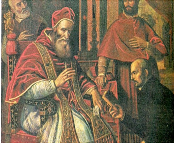
slika2:prejem kanonske potrditve.

Po romanju v sveto deželo se je posvetil v Parizu bogoslovnemu in filozofskemu študiju. Skupaj s šestimi študijskimi prijatelji ustanovi v Parizu Societas Jesu, jezuitski red. Kot dušni pastirji, misijonarji in znanstveniki si jezuiti kmalu pridobijo pomembno vlogo v kulturnem in političnem življenju. Tudi s poučevanjem na višjih šolah in vseučiliščih ali kot učitelji princev imajo člani Družbe Jezusove velik vpliv na obnovo katoliške vere. Ignacij Loyolski ustanovi leta 1551 v Rimu visoko šolo Collegium Romanum, katera je postala vzor nadaljnje jezuitske ustanove.