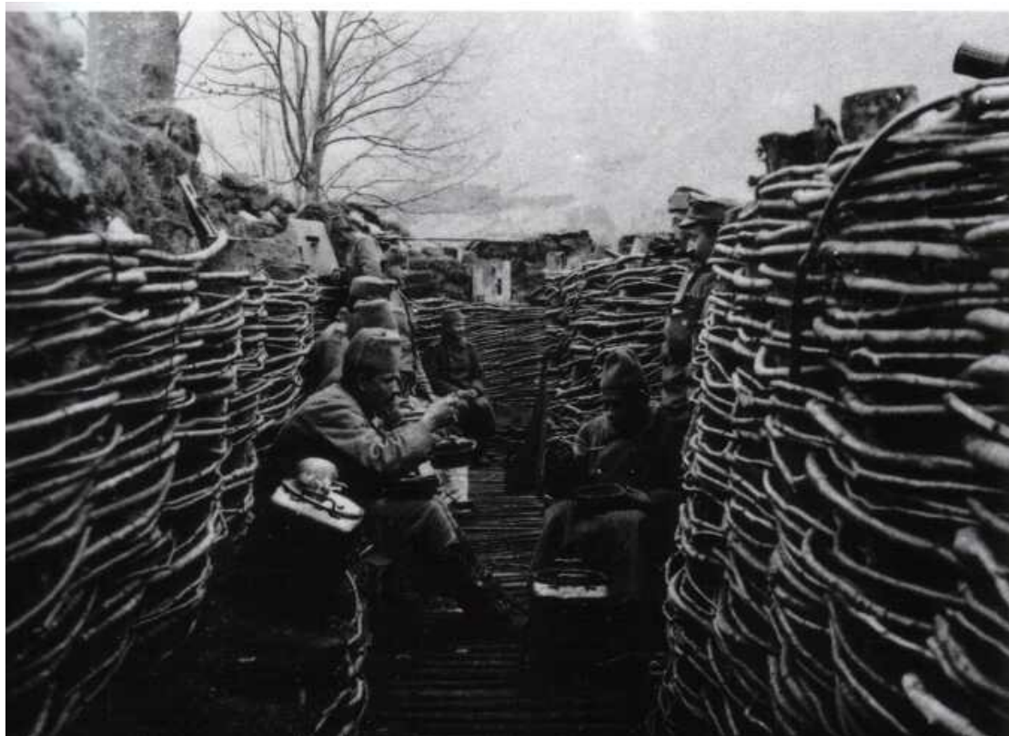
Vojaki v strelskih jarkih ob kosilu