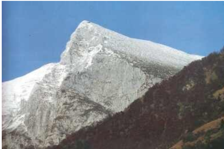
Krn (2245 m)