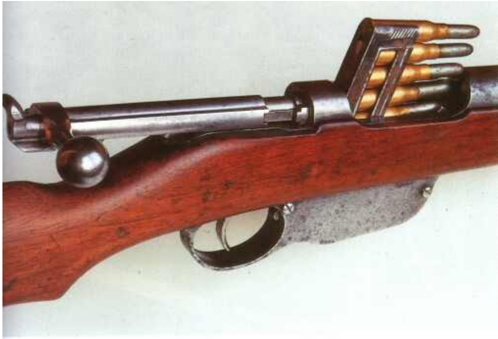
Kratka puška M 1895

Pred vojno je štela avstro-ogrška vojska 36.000 častnikov in 414.000 podčastnikov in vojakov, organiziranih v 16 vojaškoteritorialnih korpusnih območij. Slovenske dežele so bile v III. Korpsnem območju, s poveljstvom v Gradcu.