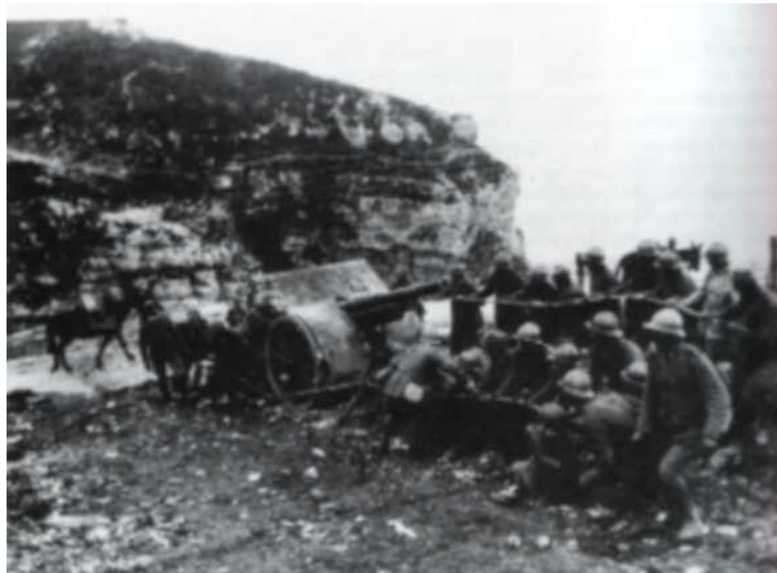
105 mm top, ki je imel domet kar 11 km

Med vojno se je kljub izgubam številčnost vojske stalno povečevala. 1. oktobra 1916 je štela že 1.800.000 mož, leto kasneje pa že 2.400.000 vojakov.