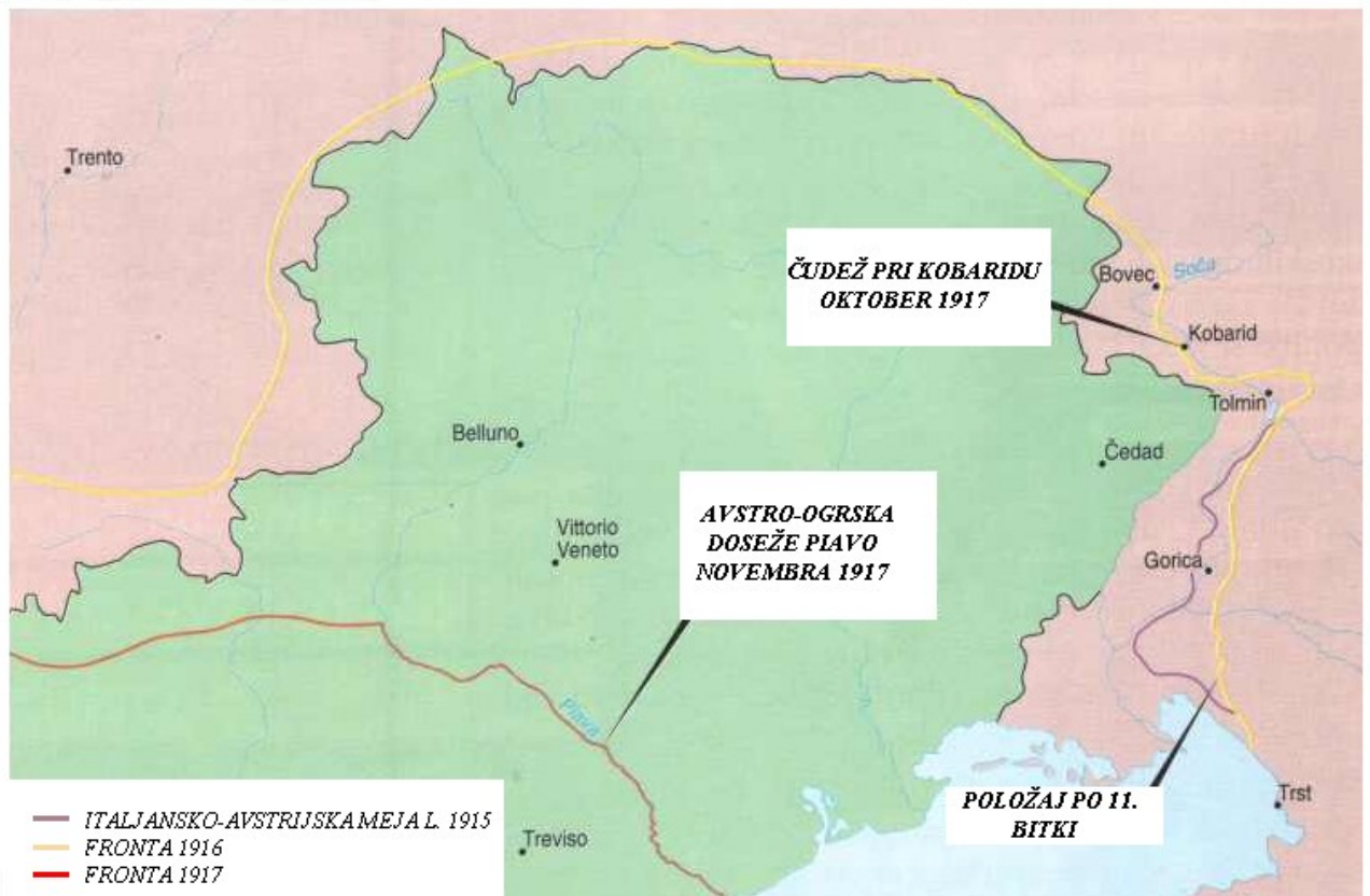
Zemljevid položajev armad med Soško fronto