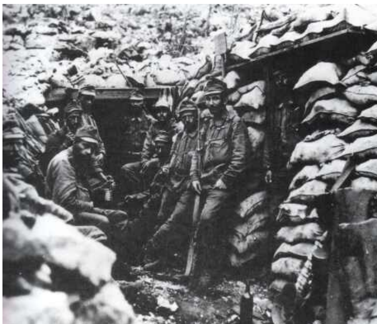
Avstro-ogrski vojaki v strelskih jarkih

Boroevićeva Soška armada je v 11. bitki sicer z zadnjimi močmi ustavila italijanski prodor na Banjšicah, vendar je bilo jasno, da nove italijanske ofenzive ne bo zdržala. Cesar Karel je prosil za pomoč Nemce, da bi skupaj pripravili protinapad v Zgornjem Posočju, kjer ga Italijani niso pričakovali. Združene avstro-ogrske in nemške enote so 24. oktobra 1917 presenetile Italijane in prebile fronto pri Bovcu in Tolminu. Že prvi dan so prodrle mimo Kobarida 18 km globoko do Robiča, ki leži na pragu Beneške ravnine. Naslednji dan so vrzeli v italijanski obrambi še razširili, italijanski poraz pa se je spremenil v katastrofo. Splošen umik, ki je ponekod prešel v paničen beg, se je končal v začetku novembra na reki Piavi, 200 km zahodnjeje.