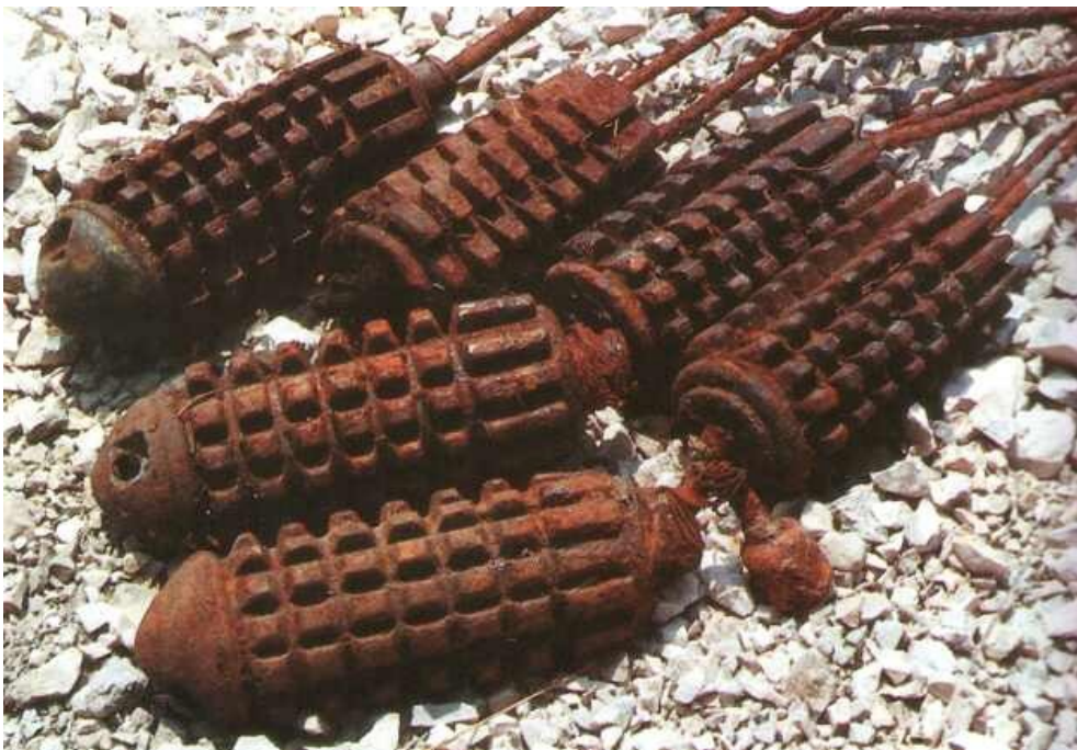
Avstro-ogrške ročne bombe

Predah po prvih štirih bitkah so Italijani izkoristili za okrepitev armade in izpopolnitev taktike - v letu 1915 so se marsičesa naučili. Nov velik napad na Soči so načrtovali za junij 1916, vendar so ga morali zaradi avstro-ogrške ofenzive na Južnem Tirolskem prestaviti na Avgust. Napad na goriško mostišče so pripravili tako skrbno, da branilci, močno oslabljeni zaradi ruske ofenzive na vzhodni fronti, niso ničesar opazili. 6. avgusta je strahovitemu obstreljevanju avstro-ogrskih položajev sledil sočasni napad italijanske pehote. V 40 minutah so Italijani zasedli Sabotin, načeli obrambo pri Podgori, le malo kasneje pa je bil v njihovih rokah tudi Šmihel. Položaj branilcev se je 8. avgusta zelo poslabšal, saj so Italijani z zasedbo Gorice dosegli velik politični uspeh, vendar so jim kljub zagrizenim napadom spodleteli vsi poskusi preboja nove avstro-ogrške obrambne fronte.