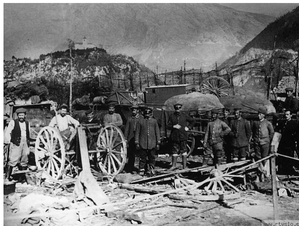
Slika 2: Polomljeni vozovi

Tako sem počasi prišel do vrha hriba in se po strelskem jarku podal na sedlo pod vrhom. In glej, v vrtači sem opazil dobro ohranjene vojaške čevlje. Čevelj je bil spredaj odprt in zagledal sem kosti narti in prstov. Med gruščem so bile napol zasute vojaške kosti, kos granate, ostanki uniforme ter razbita čelada. Imel sem čuden občutek, da me nekdo gleda in ko sem se obrnil, so iz razpoke med skalami vame strmele prazne oči lobanje.