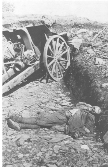
Slika 3: Posledice Soške fronte in Londonskega sporazuma

Link: http://www.freewebs.com/soska-fronta/lopati.jpg