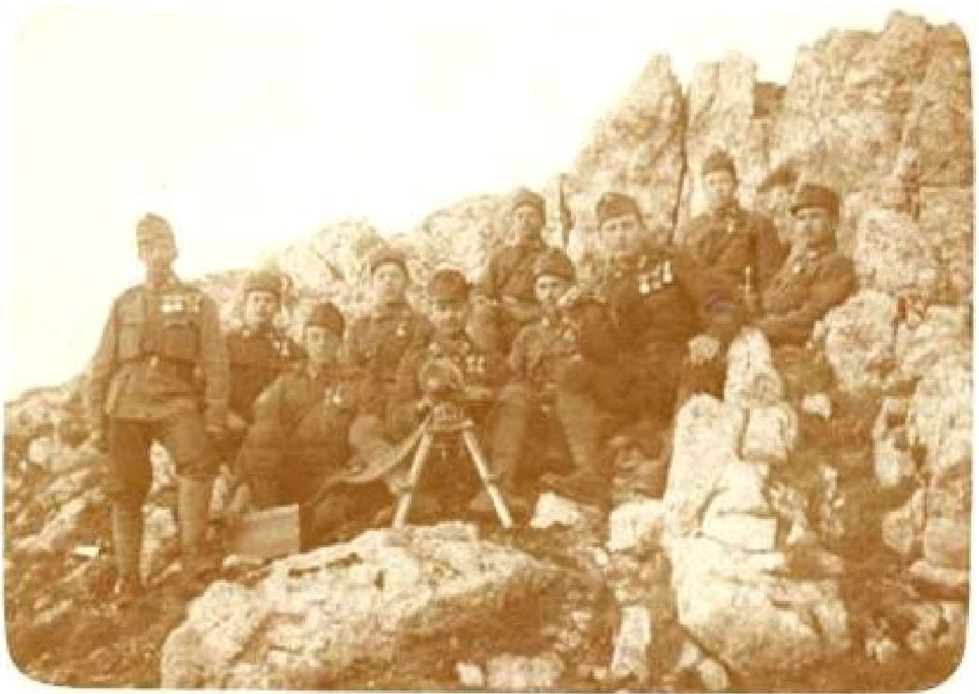
Slika 9: Vojska na gorah

Link: http://www.asatru.si/slovenija/slike/soca-11.jpg