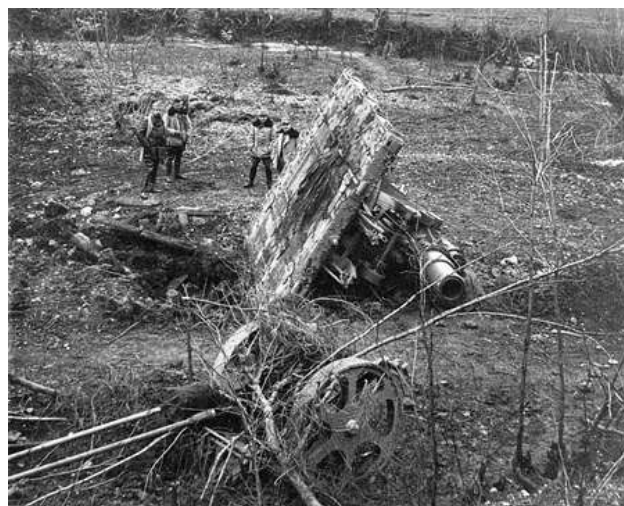
Slika 10: Top na bojišču

Link: http://www.asatru.si/slovenija/slike/soca-11.jpg