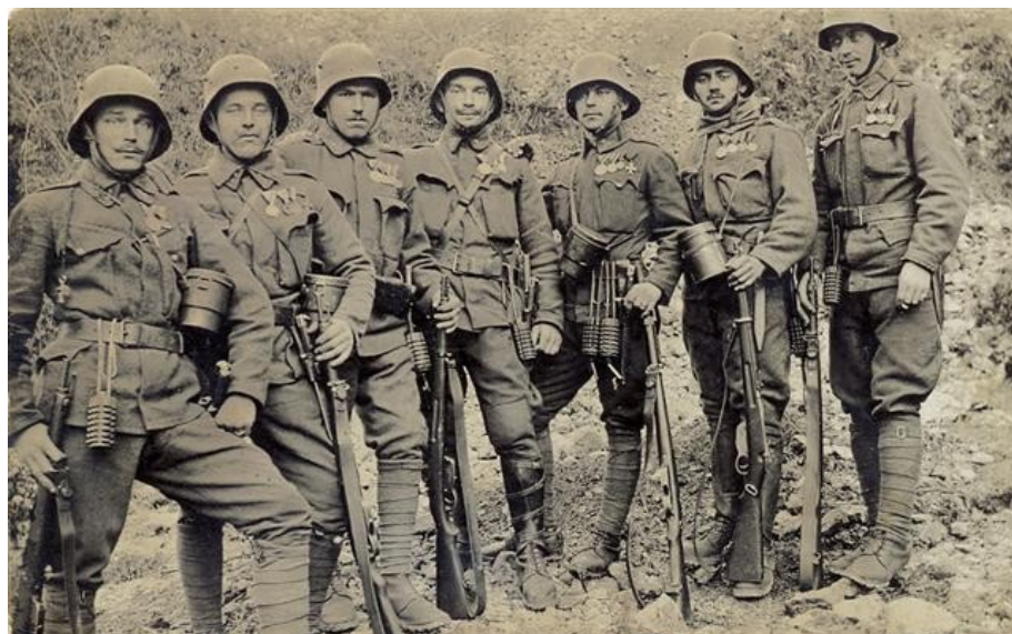
Slika 8: Vojaki A-O vojske

Link: http://upload.wikimedia.org/wikipedia/abdjfds