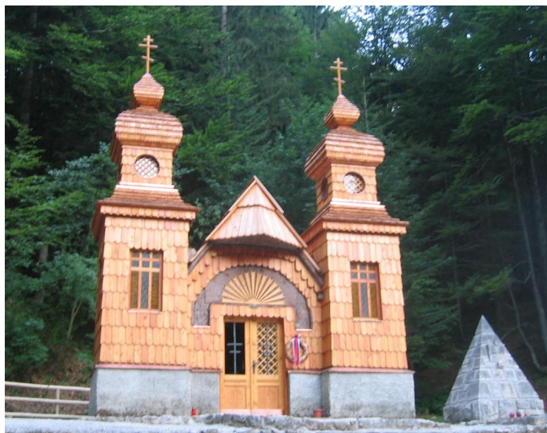
Slika 7: Ruska kapelica, posvečena ruskim delavcem, ki so gradili cesto na prelazu Vršič. Zajel jih je plaz in so umrli.

Bild 146-1970-072-25 1. Oktober 1917