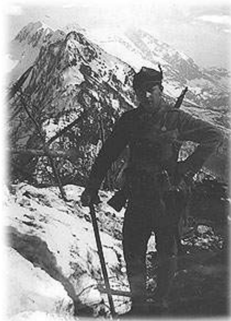
Slika 5: Drežnica

Totalna vojna: vojna, ki terja napor vseh in ki jo država vodi z vsemi sredstvi, ne glede na mednarodno vojno pravo.