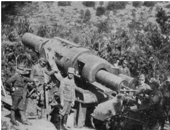
Slika 3: Možnar 305 mm sistema Škoda

Kmalu po prvi Soški bitki je sledila druga. 18. julija so začeli z obstreljevanjem na Goriškem mostišču in Krasu. Še isti dan je sledila ofenziva, ko je kar sedem divizij 3. armade napadlo avstrijske enote. Najhujši boji so potekali na vrhu Svetega Mihaela, ki je izmenjaje prehajal iz rok Italijanov v roke Avstrijcev. Na kocu jim ga je le uspelo obraniti. Edini uspeh Italijanov je bil zavzem 200 do 600 metrov pasu na Krasu med Batognico in severnim pobočjem Rombona. Vendar so zato morali plačati visoko ceno. Izgubili so namreč kar 41.000 mož, prav toliko vojakov pa so izgubili tudi Avstrijci. Po končani ofenzivi so zavzeli tudi že predhodno evakuirani Bovec. Po drugi Soški bitki so se spopadi za nekaj mesecev ustavili. 4