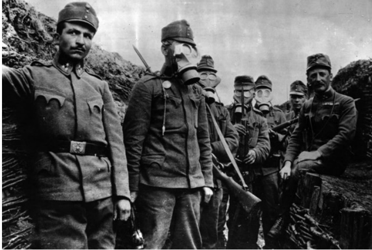
Slika 4: Vojaki z zaščito pred kemičnim orožjem